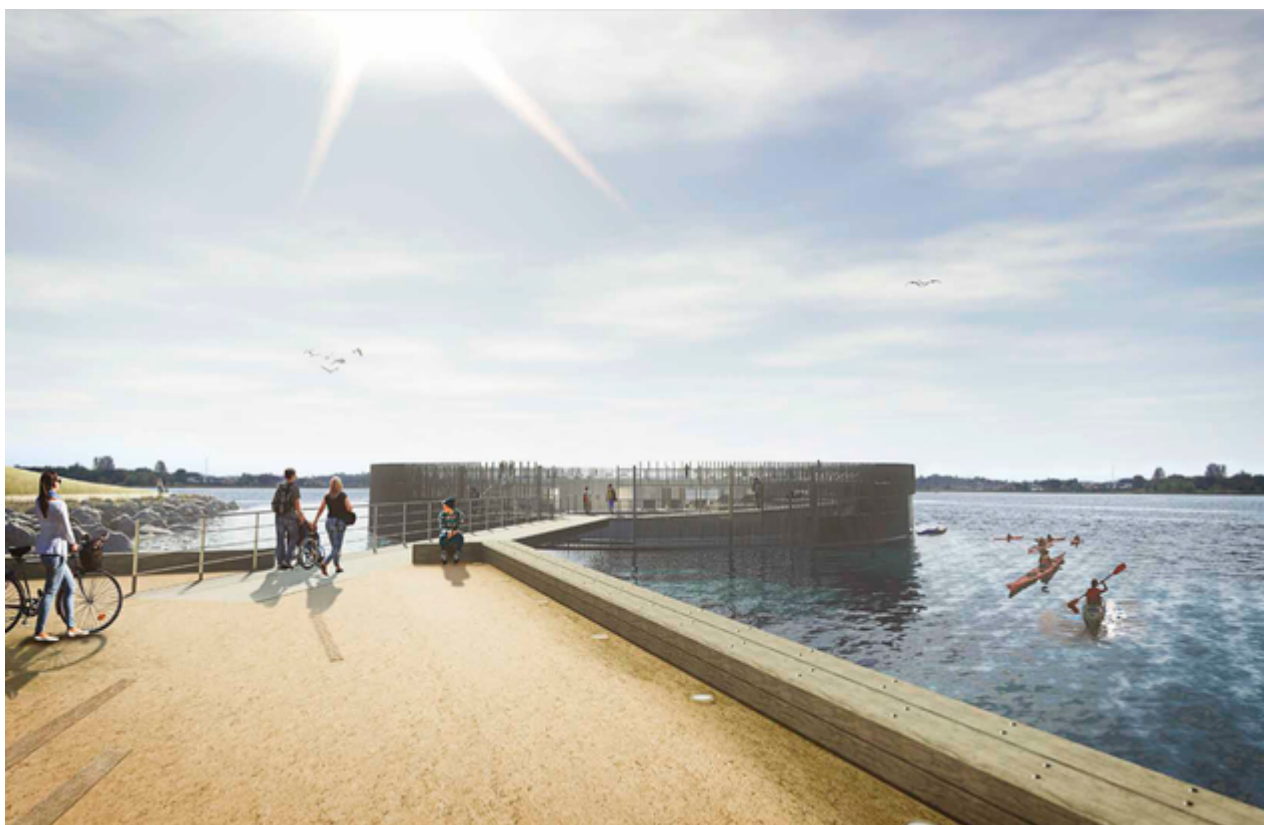
Kultur- og havnebadet ud for Tippen i Frederikssund.

Anlægget vil være tilgængeligt for alle til ophold. Badning i havnebadet vil kun være for dem, der kan svømme, idet børnefamilier med helt små børn, der ønsker at bade, dog forventes at foretrække kommunens badestrande.