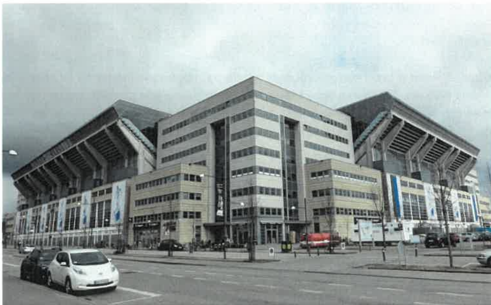
Bunker, beton og lukket.