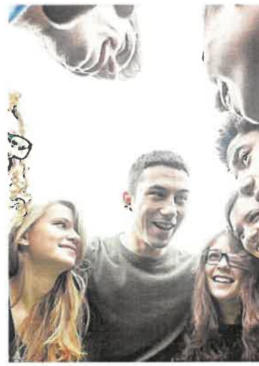
Et frit samlingssted

Speedway, gåture, møder, skydetræning, hundetræning, fællesspisning, foredrag osv.