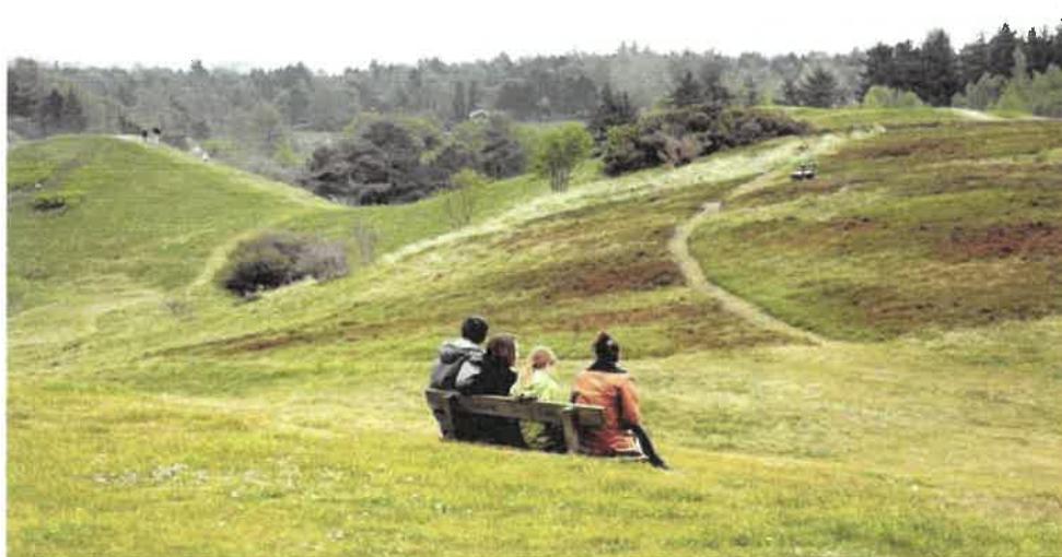
Grønt, bakket og åbent.