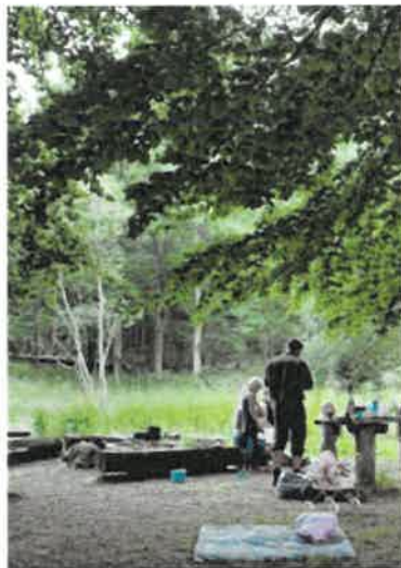
Picnic og gåture