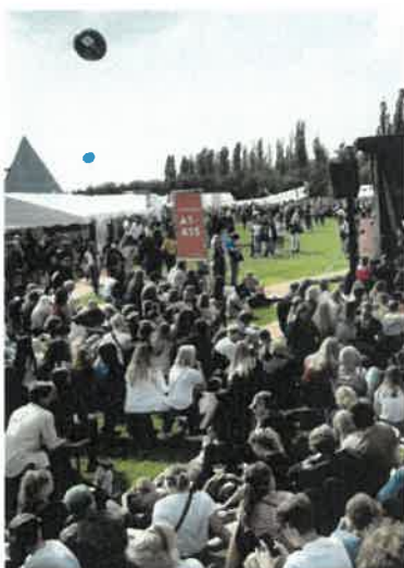
Kultur, musik og festivaler