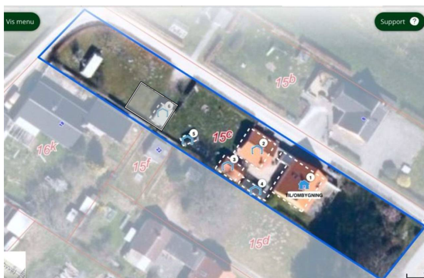
Figur 1 Situationsplan

Der søges om at opføre en garage på 7 x 10 meter (70 m 2 ) og 4 meter højt på samme placering som et nuværende skur. I forbindelse med at garagen opføres bliver det nuværende skur på 10 m 2 fjernet