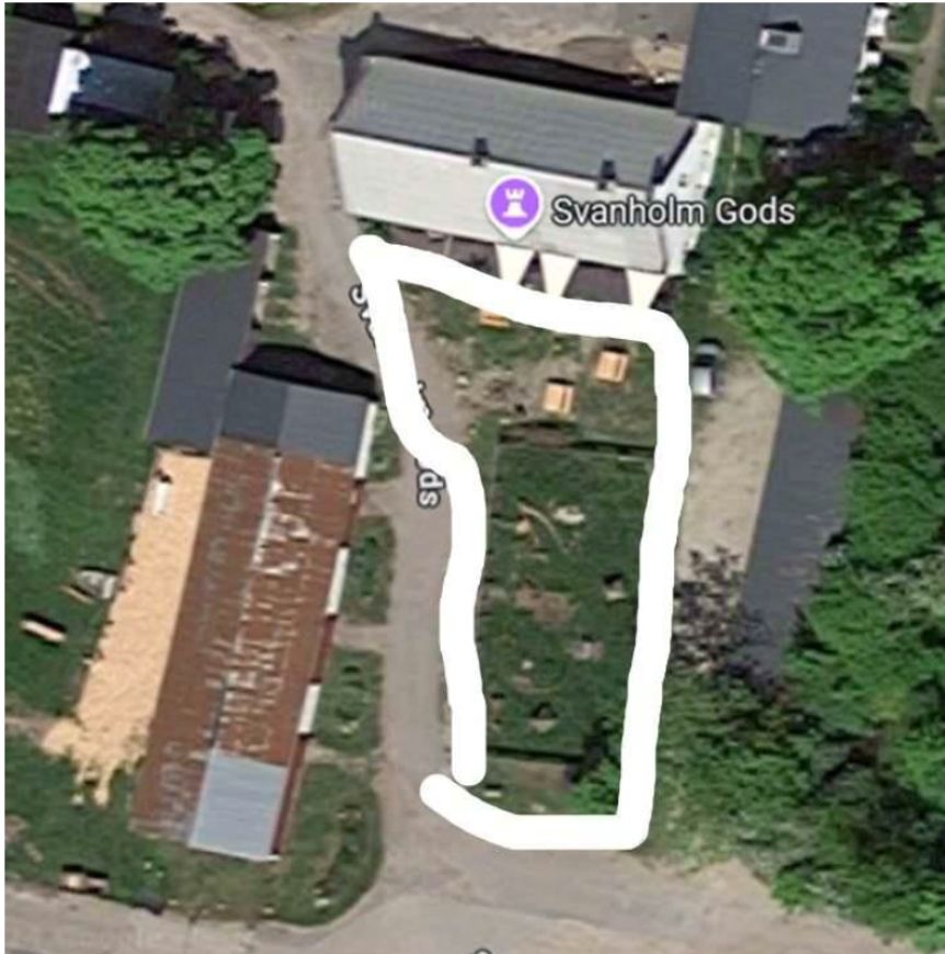
Figur 1 areal til legeområdet er markeret

Arealet skal indrettes med faciliteter, der henvender sig til offentligheden og nærmiljøet i og omkring Svanholm Gods. Der er valgt rustikt naturanlæg, der tåler meget brug og slid.