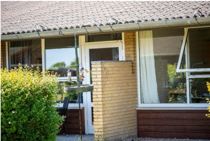
Fra omsorgscentret De Tre Ege i Jægerspris

På mødet spørger personalet ind til dit helbred, din trivsel og dine vaner. Derved kender omsorgscentret allerede lidt til dig og dine behov, når du flytter ind. Samtidig får du og dine pårørende mulighed for at stille spørgsmål.