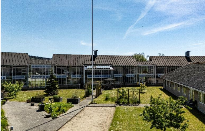
Fra Omsorgscentret Tolleruphøj i Frederikssund