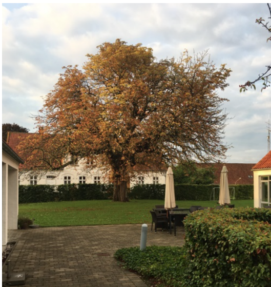
Fra Omsorgscentret Pedershave i Frederikssund