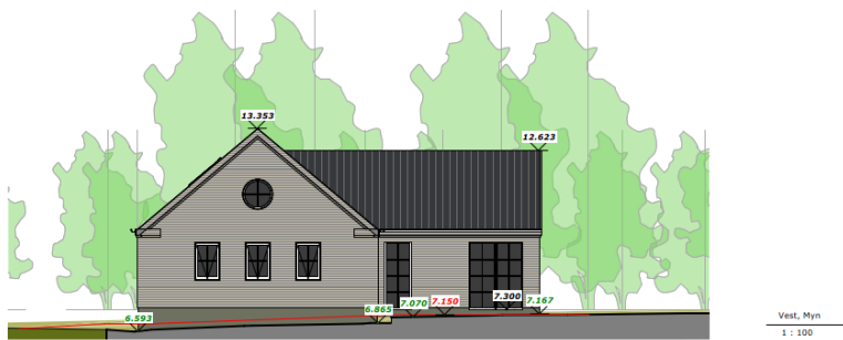
Figur 2 Facadetegning mod syd og vest