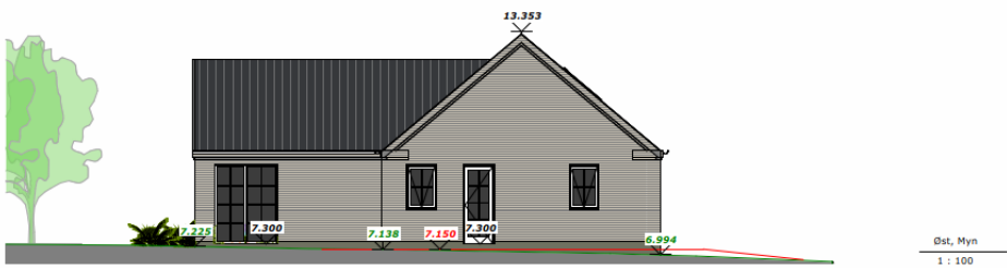
Figur 3 Facadetegning mod nord og øst