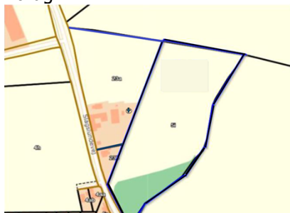
Figur 2 Situationsplan

Vindmøllen monteres på en eksisterende radiomast, som ikke længere er i brug.