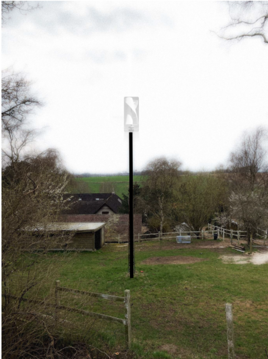
Figur 4 Visualisering