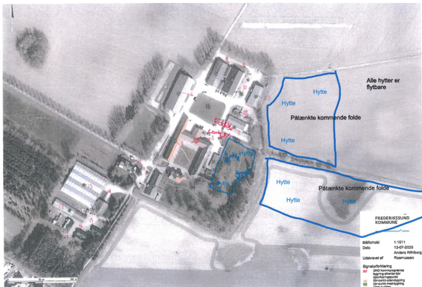
Figur 2 oversigt over folde og antal hytter på hver fold