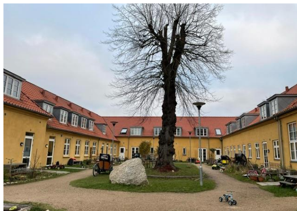
Bofællesskabet Krake hører bl.a. til i en gammel skolebygning. Derudover er der to nybyggede boligfløje og et fælleshus, der er omdannet fra en gammel musikskole.

Bofællesskabet flyttede ind bygningerne i 2020 og består primært af småbørnsfamilier (og et enkelt ældre ægtepar), der tilflyttede fra brokvartererne i København. De er 50 voksne, og det er lidt rigeligt i forhold til, hvad man kan overskue. Beboerne kendte ikke hinanden før de købte ind på projektet, men lærte hinanden at kende gennem processen. Beboerformanden anbefalede, at man som beboer hurtigt organiserer sig uden om selskabet, så man i samlet flok kan påvirke udviklingen. Der har kun været to udskiftninger i siden bofællesskabet startede ud – hvoraf kun den ene lejlighed har været til salg. Lejlighedens værdi havde steget med 25 % siden 2020. Bofællesskabet havde ingen påvirkning på, hvem der