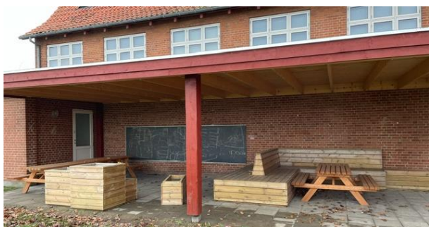
Et udendørs undervisningslokale. Overdækning er et af de nyeste tiltag på skolen.