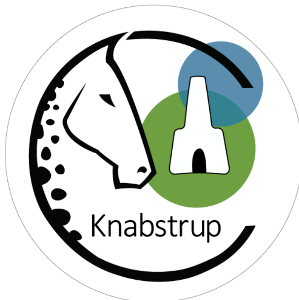
Arbejdsgruppen for bybranding, fik bl.a. fremstillet et nyt bylogo og hjemmeside. Hjemmesiden har været et af de projekter, der har været svære at vedligeholde i længden.