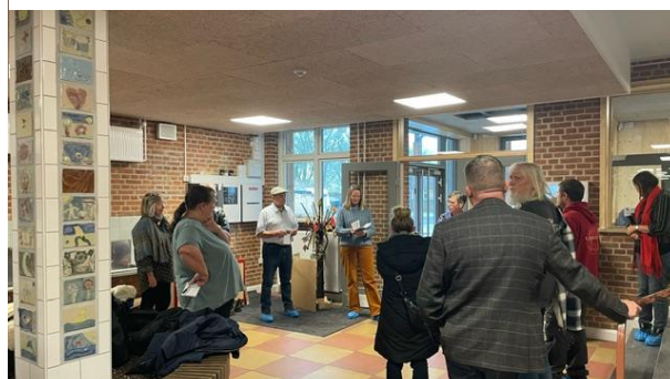
Udvalget i Knabstrup Børnehus entre. Her starter både børnehavebørn og skolebørn deres dag. Entreen markerer også skillepunktet mellem den renoverede bygning og nybyggeri. Der er bevaret mange detaljer.