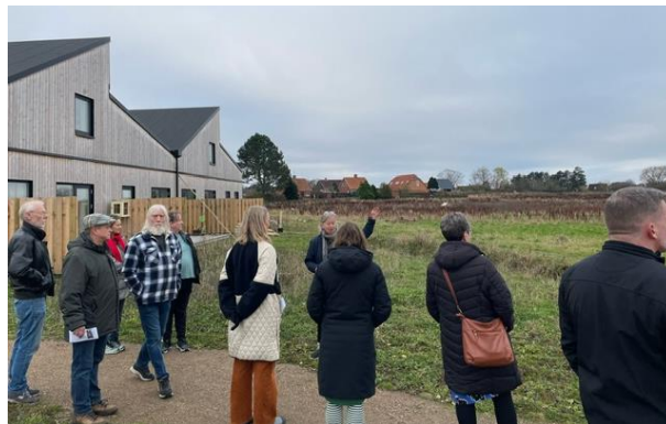
Heldige beboere i Alkes have har udsigt over et naturområde og en regnvandssø.

Til Skuldelev Udvalgets større borgermøde vil de anbefale; at lægge det en lørdag og give børnene en rolle, så man kan nå børnefamilierne, at være meget