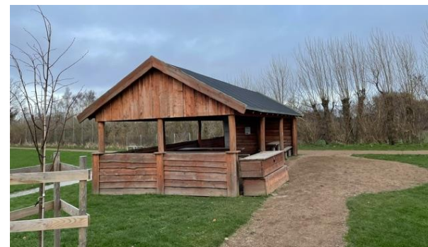
Denne hytte med pizzaovn er en af de eneste konstruktioner der ikke er bygget af forældre selv.