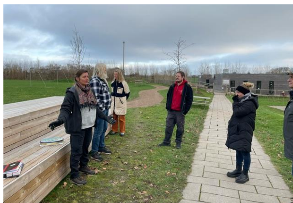
T.v. ses et siddemøbel, der er utroligt populært blandt de ældre skoleelever.