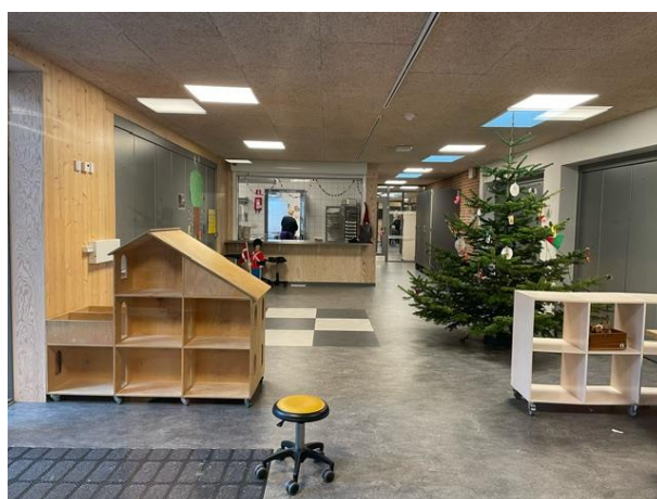
De grå døre på hver side af rummet kan skydes til side og dermed forbinde gangen med gymnastiksalen og en af stuerne, og dermed skabe et meget større rum til fællesarrangementer.