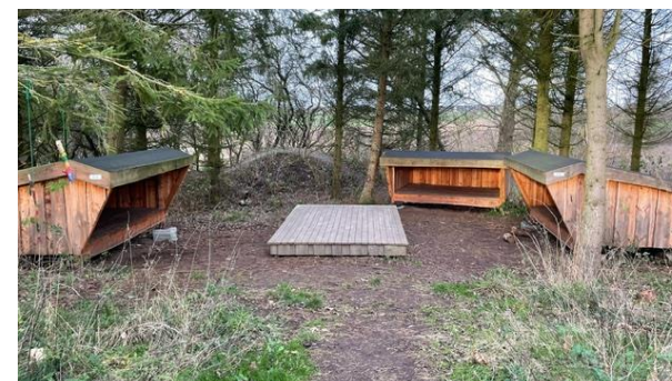
Shelterne er finansieret af Friluftsrådet. Da området ligger blandt grantræer er der en forhøjet scene frem for en bålplads.