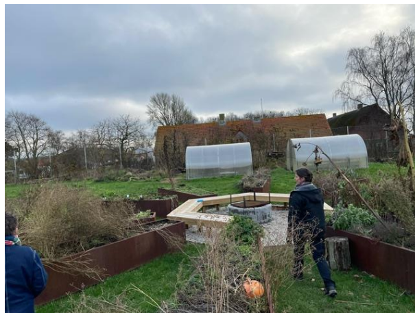
Projektlederen beskriver selv skolens nyttehaver omkring bålpladsen som det mest vellykkede projekt. Hver årgang har sit egen højbed.

Gruppen fik tidligt en forælder, der er landskabsarkitekt, til at tegne projektet, så det så professionelt ud. Den tegning har været ekstremt brugbar i fondsansøgningerne. De anbefaler at samle støtteerklæringer fra lokale erhvervs- og foreningsliv til at vedlægge ansøgningerne. Det gælder også om at have øje for nye muligheder og tidsånden. For eksempel fik de støtte fra Landdistriktsstyrelsen pulje til landfaste vindmøller, fordi de er naboer til en vindmølle og de har været gode til at bruge de rigtige 'buzzwords', der har passet til de forskellige fonde. Det har taget tid at sætte sig ind i bureaukratiet bag de forskellige fonde, så man skal være klar til at aflaste hinanden. Man kommer ingen vegne uden ildsjæle, så derfor skal man passe på sine frivillige.