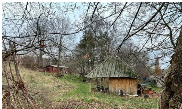
Bofællesskabet Krake har et stort fælles udeareal, der bl.a. huser en bålhytte (på billedet), hønsegård, legeplads, nyttehaver og en (nu tom) kaningård.

Renoveringen har fokuseret på fleksible planløsninger, så flere rum kan lægges sammen. Det udnyttes til fællesarrangementer og når skolen holder arrangementer for forældre. Der har været fokus på at beholde elementer fra den tidligere bygning for at videreføre skolens identitet. Det ses især i entreen, hvor en gammel håndvask og klinker lavet af tidligere elever er bevaret.