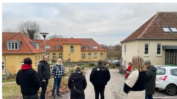
Udvalget foran indgangen til Bofællesskabet Krake.