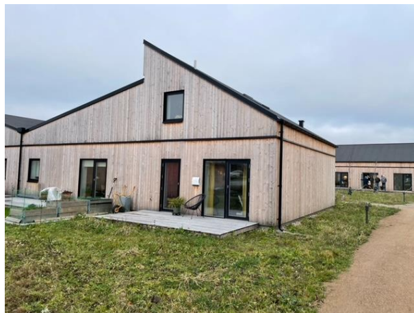
Et af dobbelthusene i Alkes have. Boligerne har forskellige størrelser og udformninger. De er bygget ned fokus på bæredygtighed i materialer og byggemetoder.