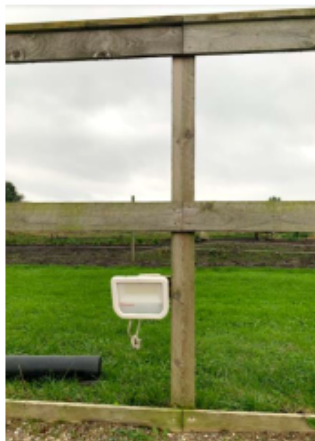
Figur 2 Ridebanen, som den så ud, da den blev etableret i 2021, samt lyssætningen

Ridebanen benyttes til ride træning og er kun til privatbrug.