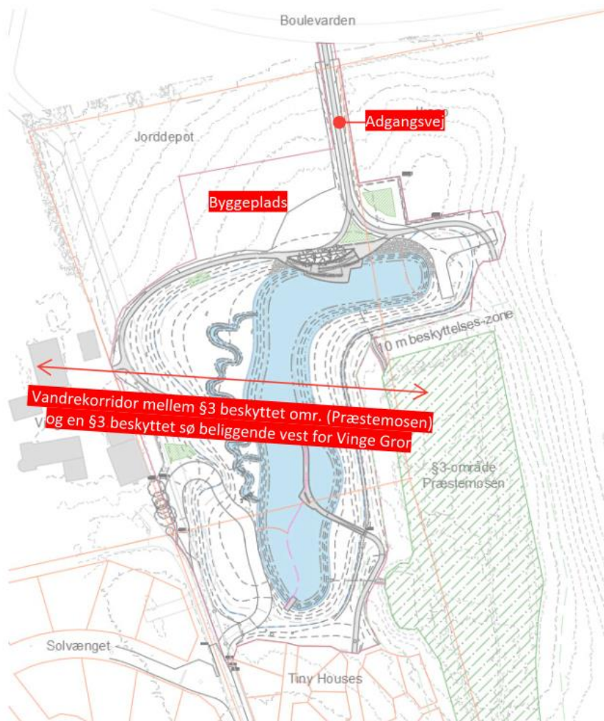
Figur 1 Oversigtstegning over placering af byggeplads mellem bassin B308-2 og Vinge Boulevard

I forbindelse med anlægsarbejderne til regnvandsbassinet, søges der om midlertidig byggeplads. Placering af byggepladsen ses nedenfor: