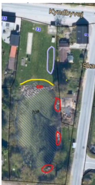
Figur 2 Kort med angivelse af ønskede indgreb i/ved Kyndby Gadekær

Den opgravede jord placeres i et jorddige eller alternativt i en rund jordvold, som kan tilsås med blomster mv.