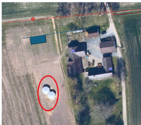
Figur 2 Situationsplan. Den blå firkant er den nye placering af læskurene. Den røde markering er nuværende læskure, som fjernes i forbindelse med etablering af nye læskure

Der står to sammenbyggede læskure på ejendommen, som fjernes i forbindelse med etableringen af de nye læskure.