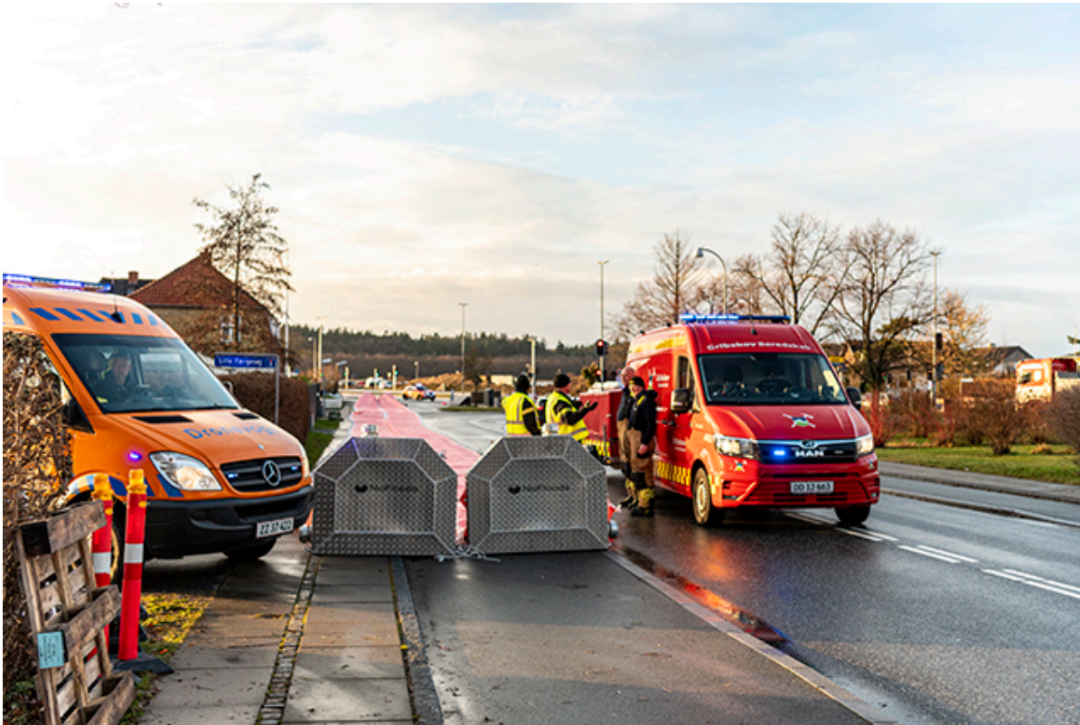
Watertube på Færgevej i Frederikssund.

Onsdag den 20. december udlagde beredskabet watertubes en række steder i Frederikssund Kommune. Arbejdet fortsætter torsdag den 21. december med at fylde dem op med vand.