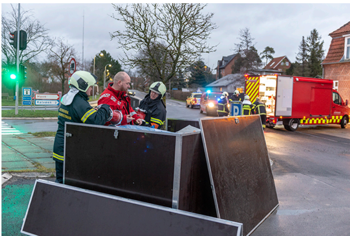
Beredskabet i gang med udpakning af watertube ved Færgevej i Frederikssund.

Fra cirka kl. 17.00 onsdag spærres Kronprins Frederiks Bro for trafik.