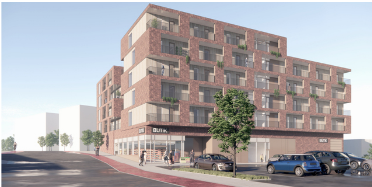
Illustration: Innovater, Nordconsult Arkitektur.

Frederikssund Kommune har stillet krav om bæredygtig DGNB-certificering af byggerierne, hvilket alle investorer vil leve op til.