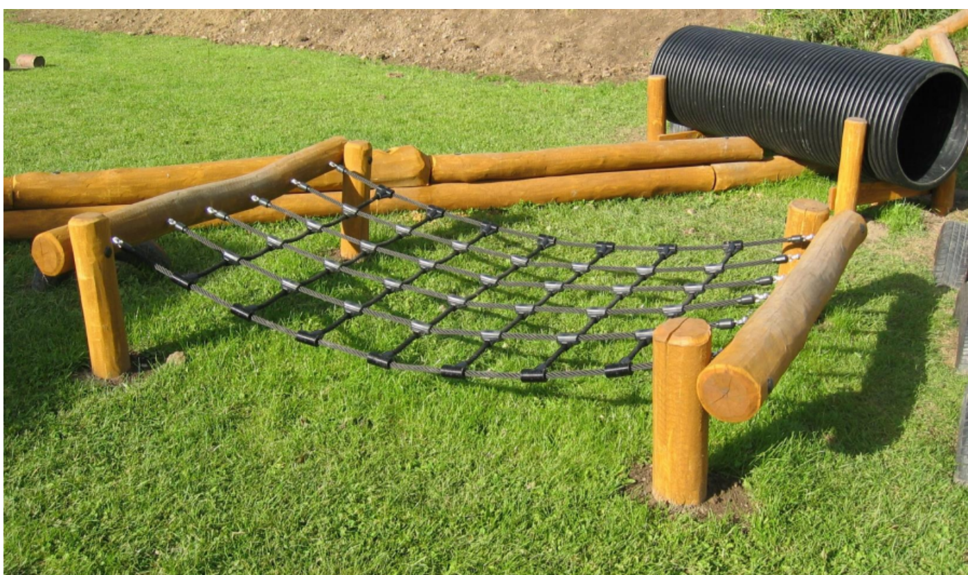
Elementer i træ og reb til en forhindringsbane på den kommende legeplads.