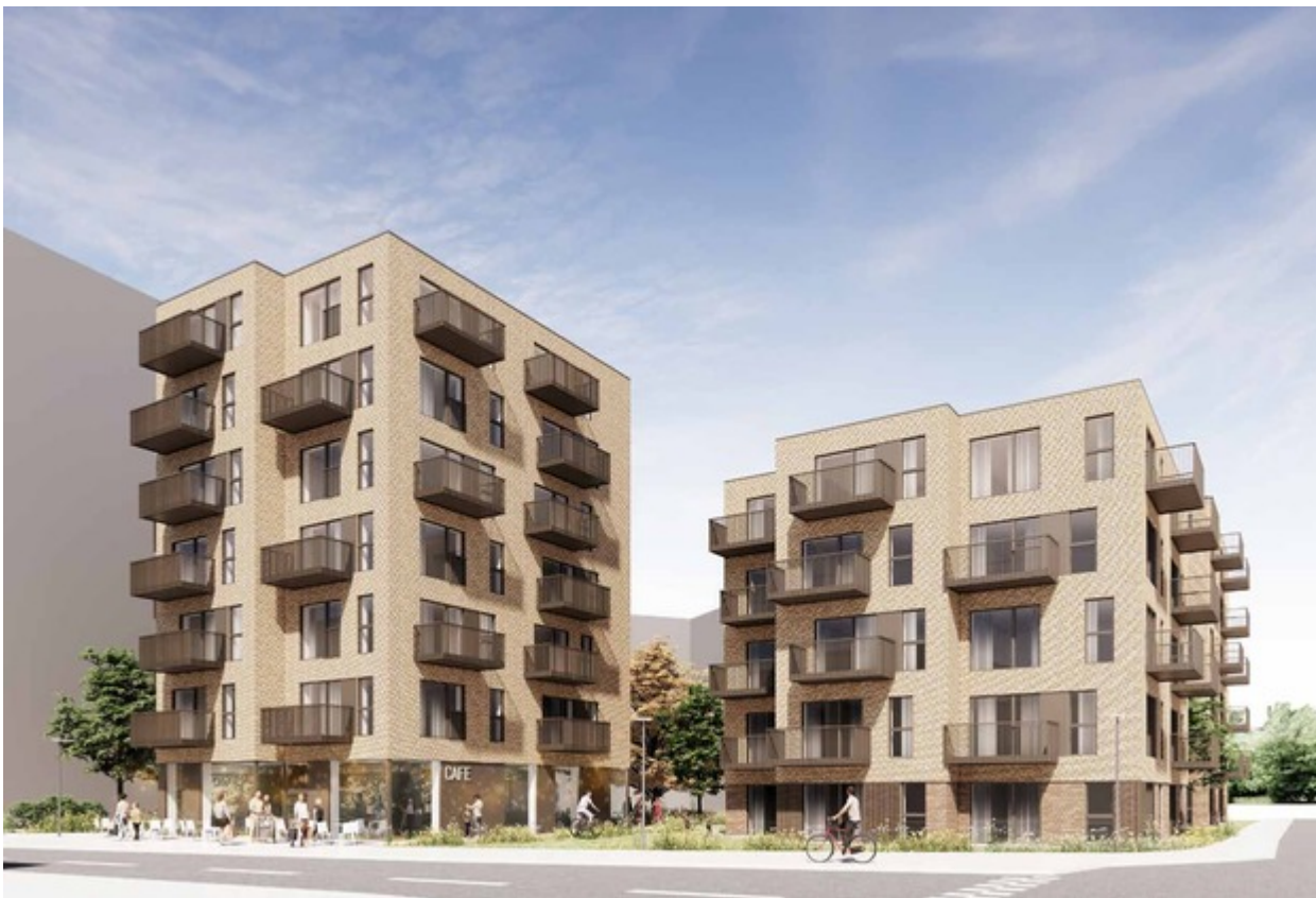
Visualisering af Innovaters kommende byggeri i op til syv etager i Vinge.

Med dette seneste købstilbud fra Innovater, som har en optionsperiode på seks måneder, tegner der sig nu en endnu større byggeaktivitet i Vinge end først antaget. Med købsaftalerne tidligere på året er der nu udsigt til i størrelsesordenen 550 nye boliger i Vinge over de kommende år. Noget af det første byggeri, der påbegyndes, er Domeas 198 almene boliger lige syd for stationen i Vinge.