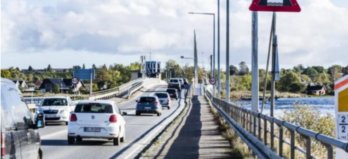
Biltrafik på Kronprins Frederiks Bro.

Vejdirektoratet skal i gang med en større reovering af Kronprins Frederiks Bro. Det betyder lukning af kørebanerne på broen fra den 13. marts til den 22. april, og kun cyklister og fodgængere kan benytte broen, mens arbejdet står på.