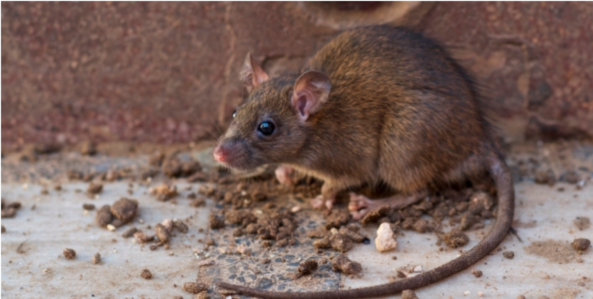
Rotte ved husmur.

Rotter elsker overdækkede og tørre arealer. Derfor har du som grundejer pligt til at rottesikre din ejendom, så rotterne ikke slår sig ned hos dig.