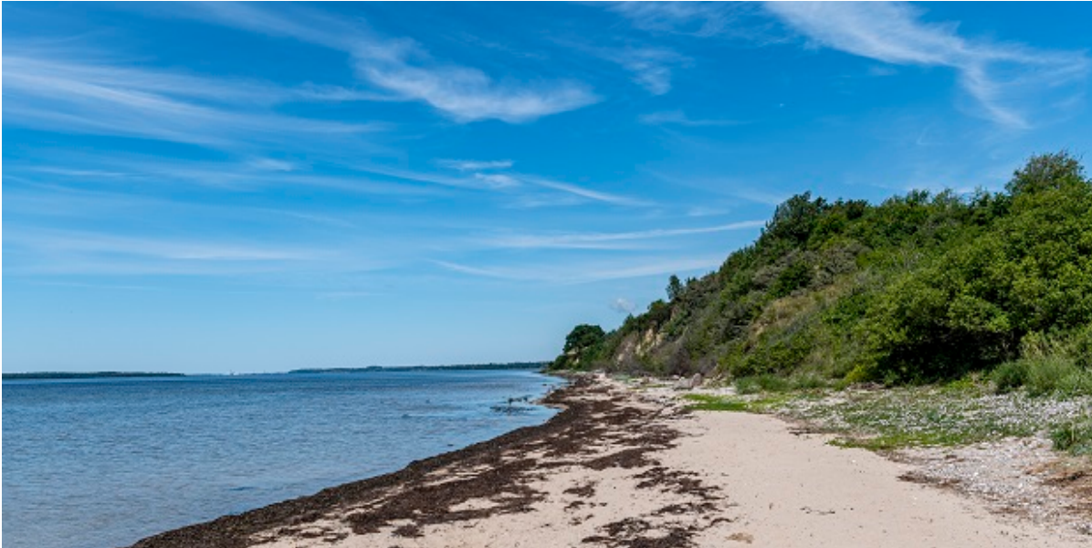
Klinten Strand på en solskinsdag.

De seneste prøver af vandkvaliteten viser, at vandet nu igen er godt badevand ved Klinten Strand.