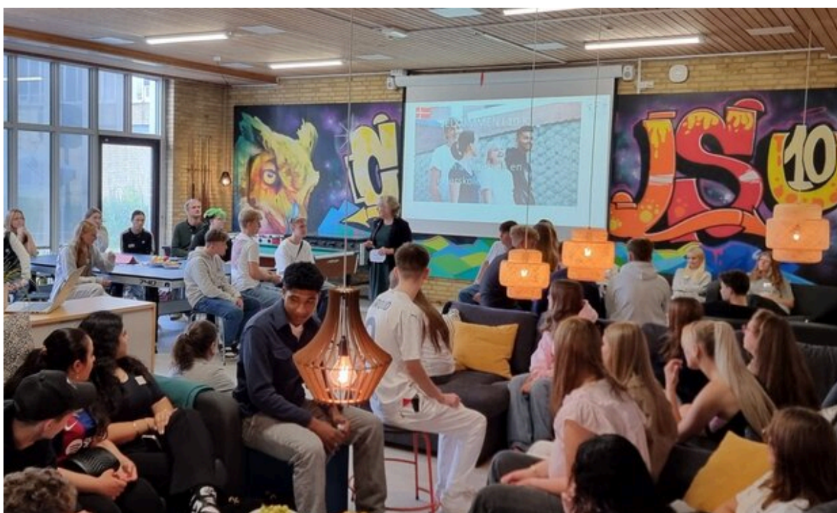
Første skoledag for 10. klasserne. Borgmester Tina Tving Stauning (A) byder velkommen i

Efter nogle magre år flokkes de unge nu om 10. klasse på Campus U10 i Frederikssund. Det skyldes et nyt og tæt samarbejde mellem en lang række aktører, der tilsammen kan tilbyde de unge et væld af fag, emner og aktiviteter – også efter skoletid. Alt sammen med skoleglæde i fokus.