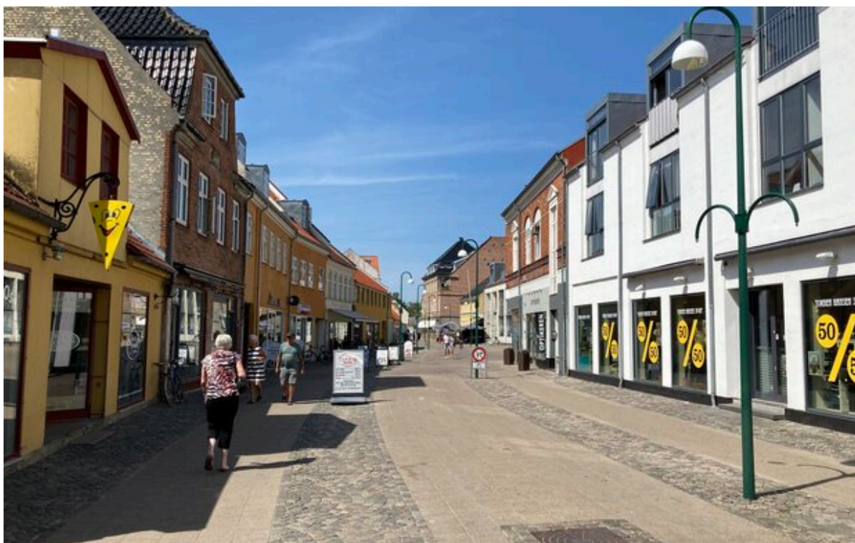
Jernbanegade i Frederikssund med butikker, gadeskilte og mennesker i gaden.