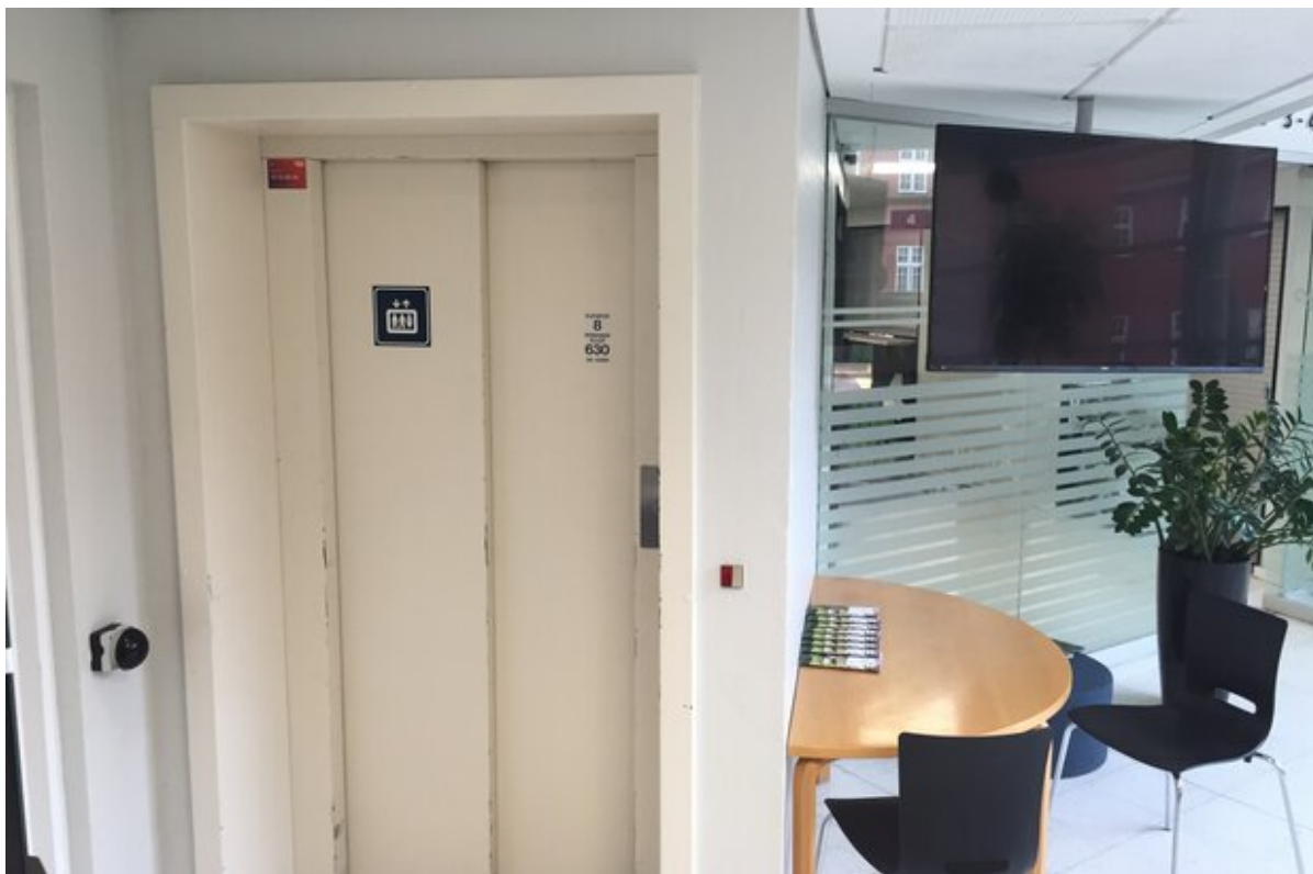
Rådhusets elevator i forhallen.