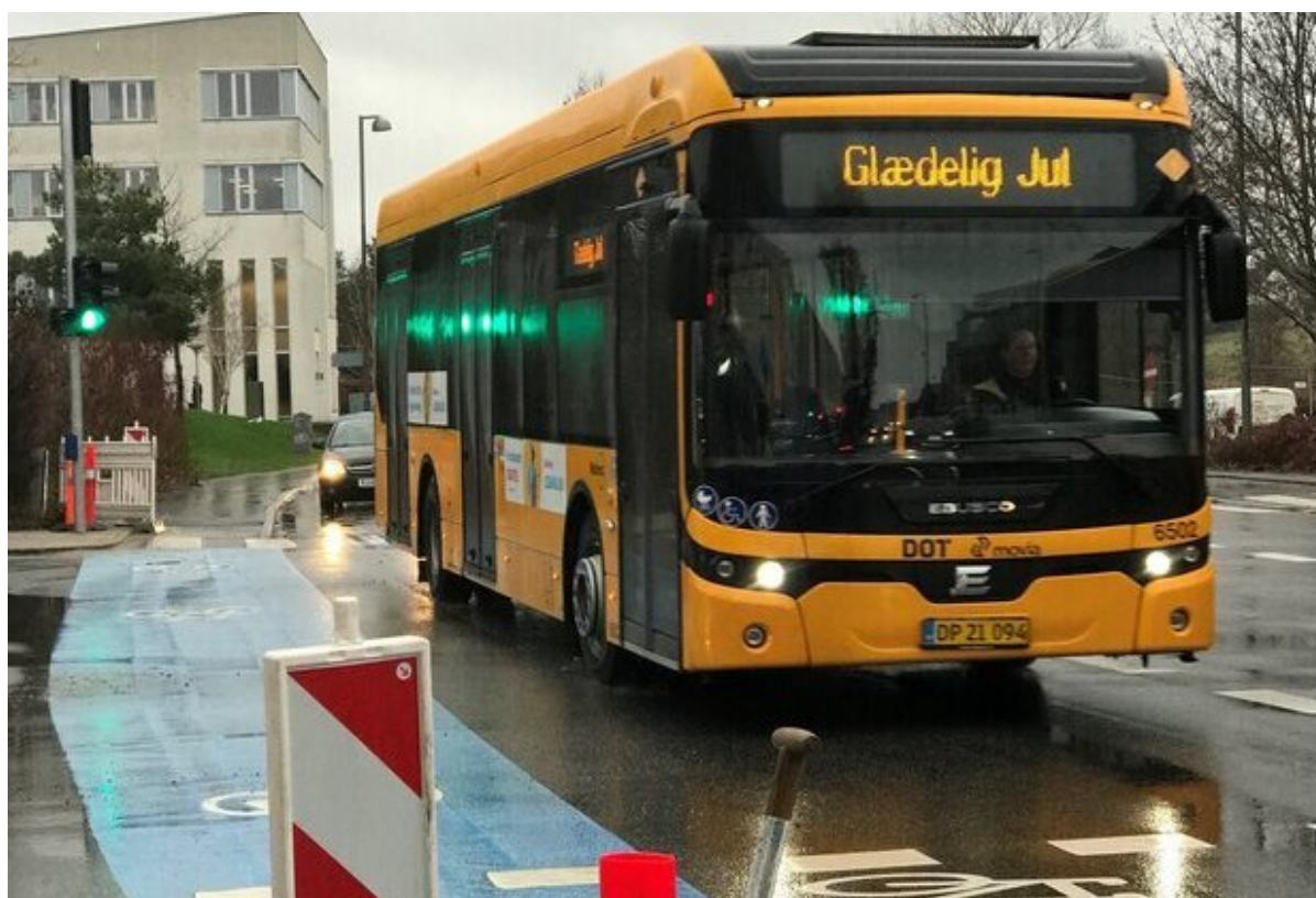
En bus kører gennem det nye lyskryds.

Frederikssund Kommune har med puljemidler fra Trafikstyrelsen og Region Hovedstaden fået opsat et nyt lyssignal i krydset Bakkegade/Ågade i Frederikssund og fået udskiftet det gamle signalanlæg i lyskrydset mellem stationsområdet og Jernbanegade. Nu kan lyssignalerne kommunikere direkte med busserne.