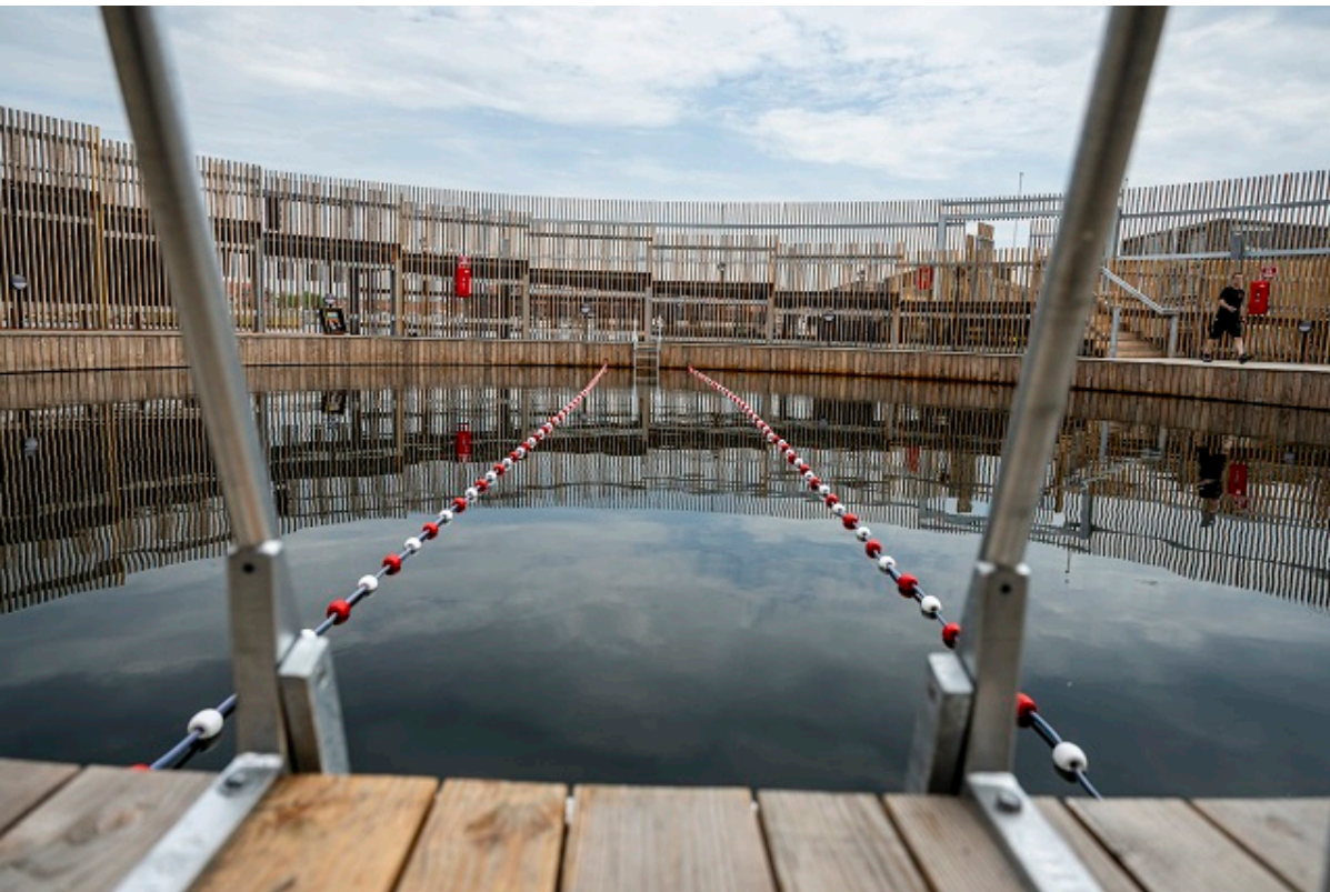
Kultur- og Havnebadets indvendige bassin.

Fra januar 2025 ændres Frederikssund Kommunes udbudsproces. Fremover udsender vi ikke længere udbud gennem nyhedsbrevet.