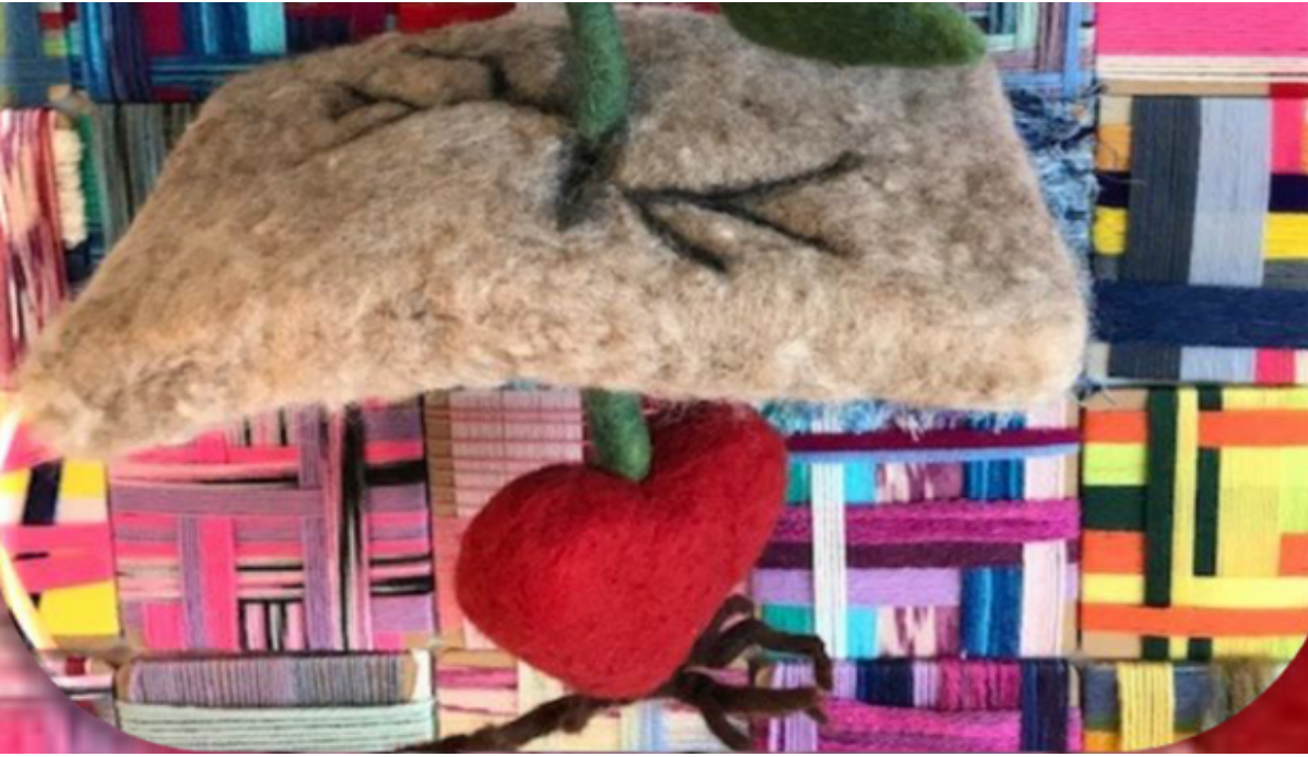
Et stykke kunsthåndværk med et filtet rødt hjerte på en pil.