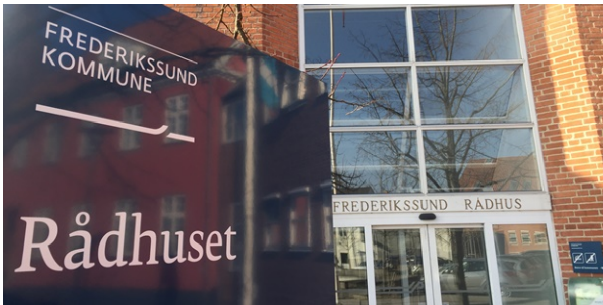
Rådhusets hovedindgang.