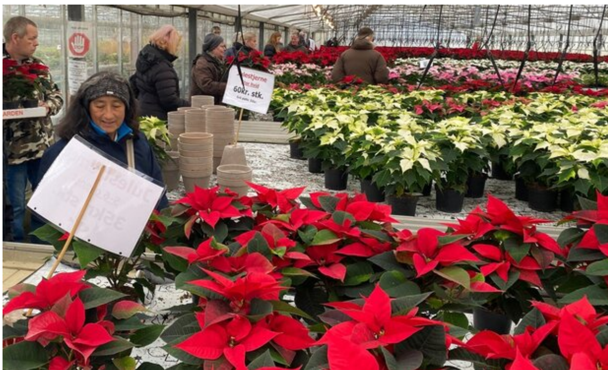
Et drivhus fyldt med røde og hvide julestjerner.