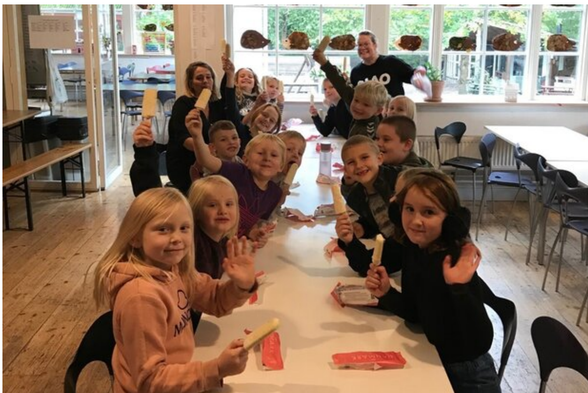
1. gult hold på Slotsparkens Friskole vandt is til hele klassen.

I år var flere elever end nogensinde før med i Alle Børn Cykler, og forleden var det så tid til at præmiere de heldige vindere.