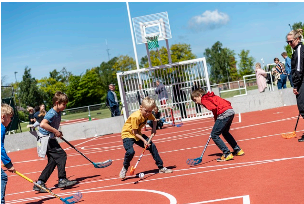
Børn spiller hockey udendørs.

Frederikssund Kommunes fritidspas er blevet en stor succes på kort tid. Indtil videre er 213 børn, der ellers ikke havde ressourcer til det, kommet i gang med en fritidsaktivitet i 2024.