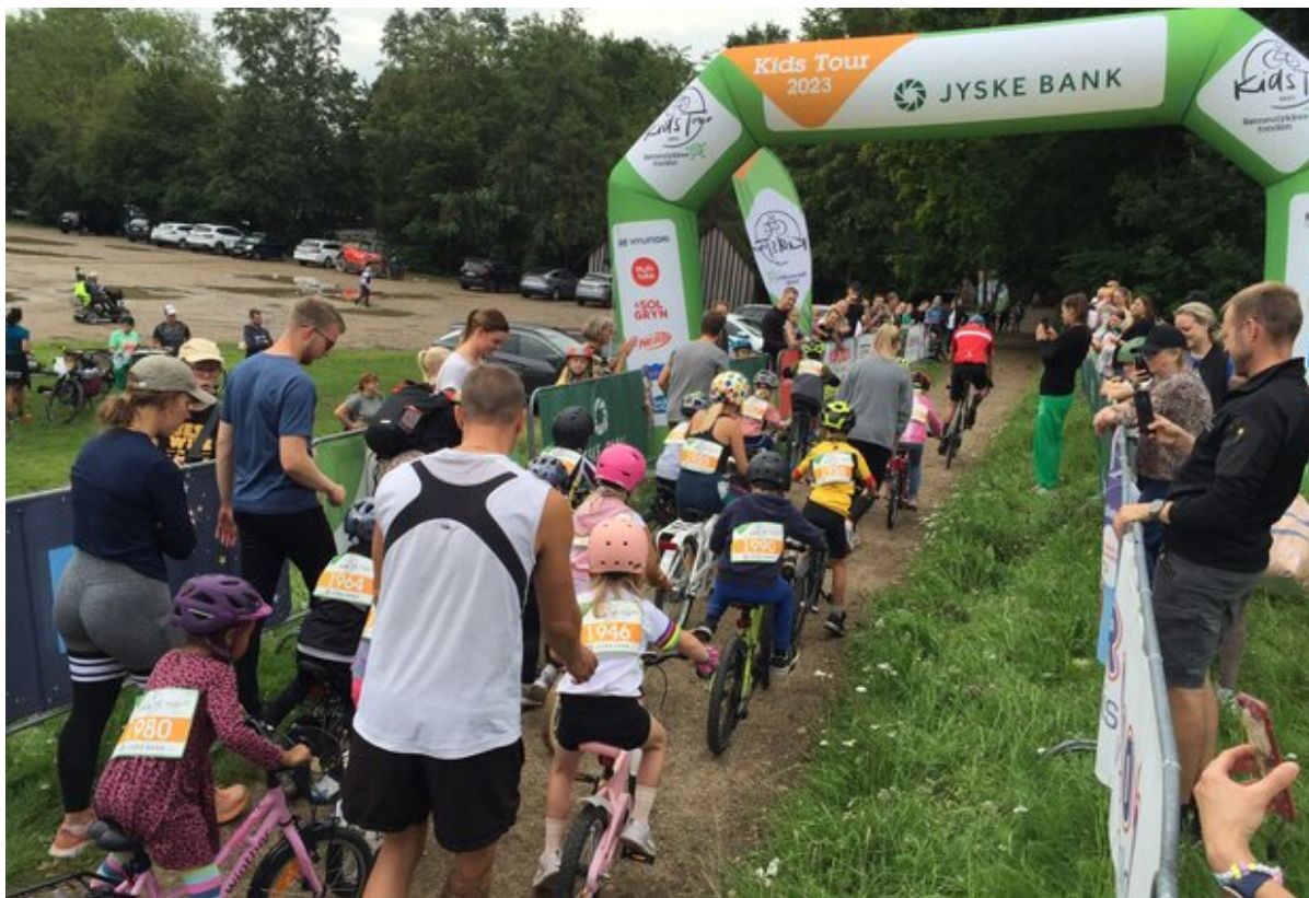
Målområdet på Kalvøen ved Kids Tour i 2023.