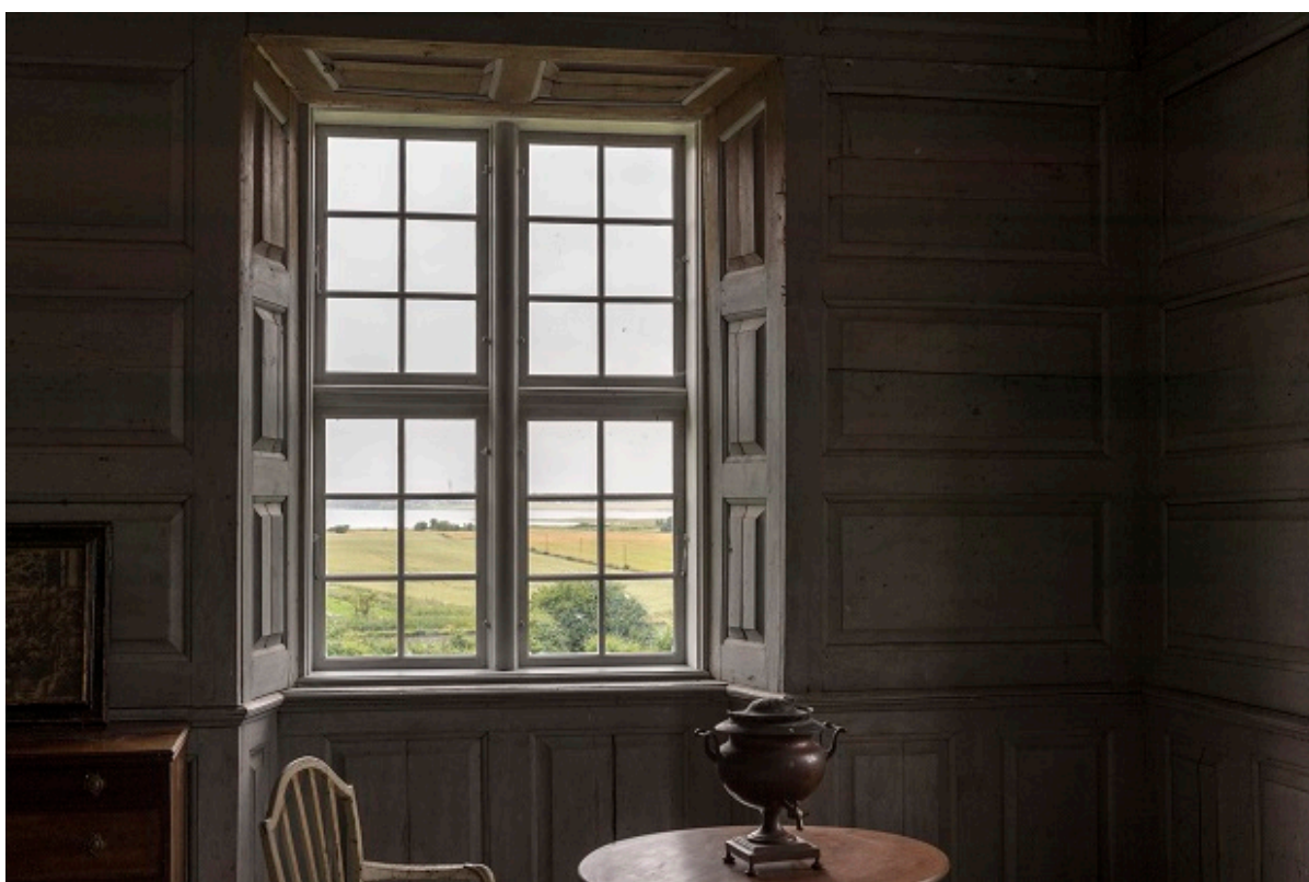
Vindue på Selsø Slot.

Bestyrelsen for Selsø Slot har modtaget den glædelige nyhed, at Aage og Johanne Louis-Hansen Fonden har bevilliget 2 mio. kr. til restaurering af slottes vinduer. Selsø Slot nærmer sig derfor en fuldfinansiering af det store renoveringsprojekt