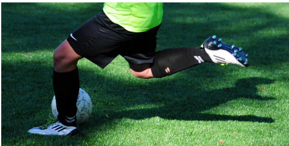
Fodboldspiller sparker til bold.

Efter nogle hårde coronaår, hvor foreningslivet måtte leve med et hav af restriktioner, medlemsflugt og færre frivillige, er borgerne i Frederikssund Kommune nu i stort tal på vej tilbage til idrætsforeningerne.