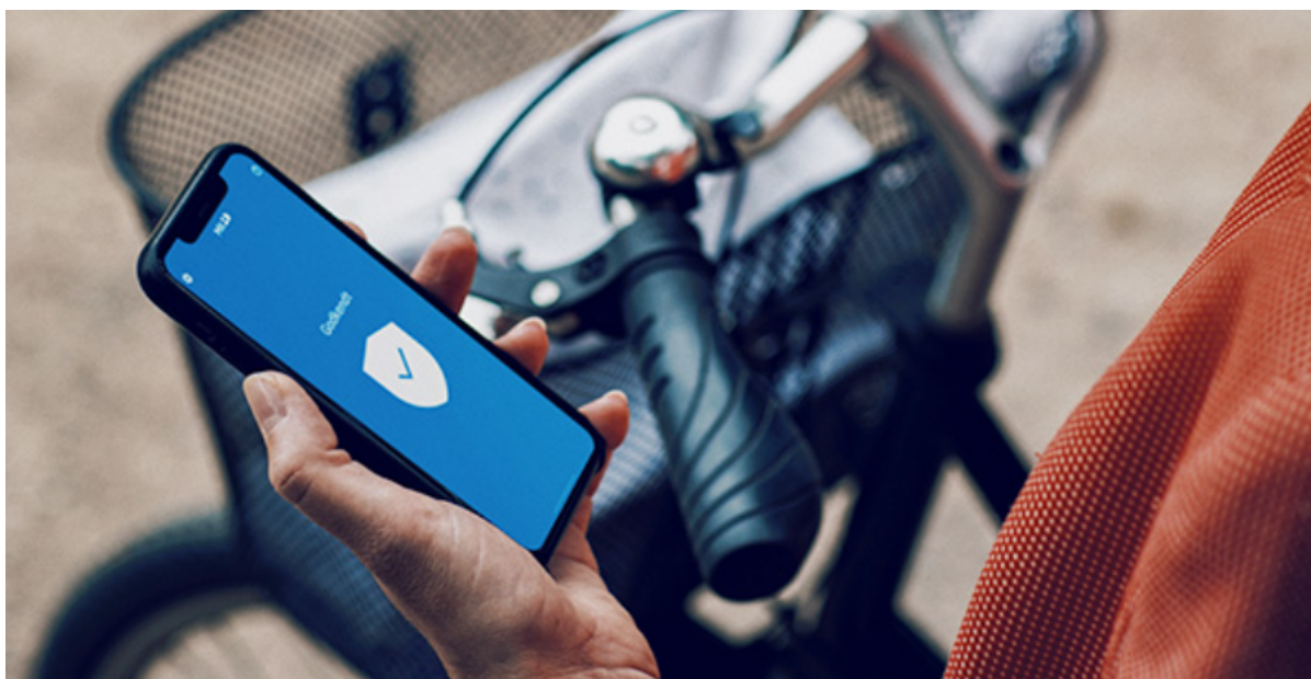
Hånd holder mobiltelefon med MitID app åben.