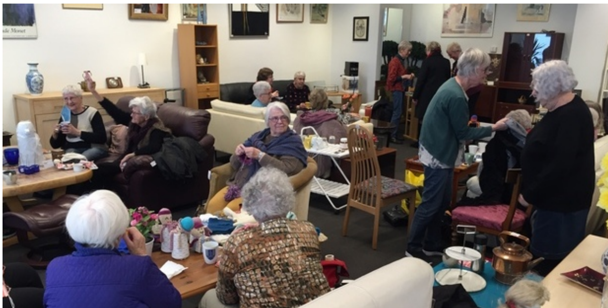
Nørklerne har indtaget sofaerne i Røde Kors butikken i Frederikssund.