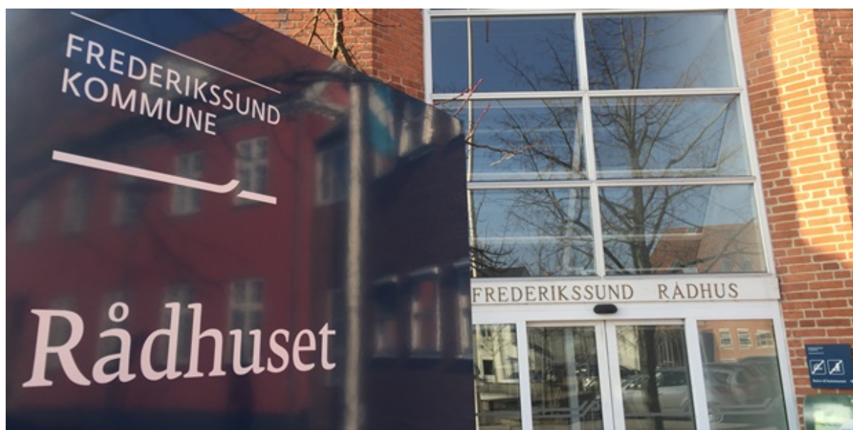
Rådhusets hovedindgang.

Udvalget Social- og sundhed inviterer frivillige organisationer, grupper og foreninger, der arbejder med frivilligt socialt arbejde i Frederikssund Kommune til dialogmøde.