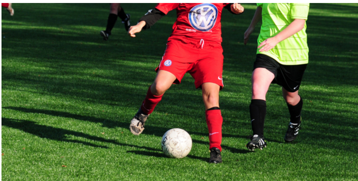
Fodboldspillere dribler med bold.

Søndag den 28. august inviterer Folkeoplysningsudvalget til prisfest i foreningslivet. Ud over uddeling af idræts-, leder- og fritidspris kan alle interesserede nu også prøve kræfter med en række forskellige sportstilbud.