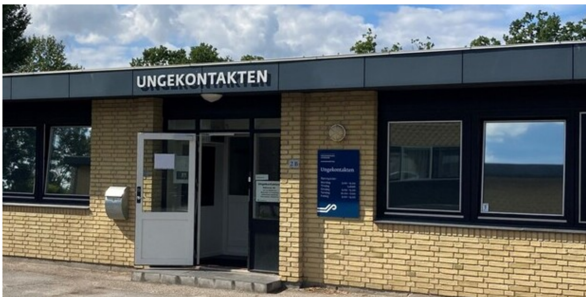
Ungekontaktens indgang.

På torsdag d. 25. august inviterer Ungekontakten alle interesserede pårørende til infomøde om, hvad det vil sige at have et forløb i Ungekontakten, hvilke tilbud der er, og hvordan man som pårørende kan støtte op om indsatsen.