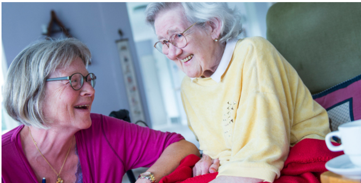
Ældre borger i samtale med medarbejder.