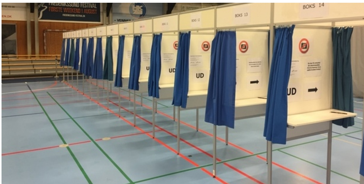
En række stemmebokse i Frederikssundhallen.