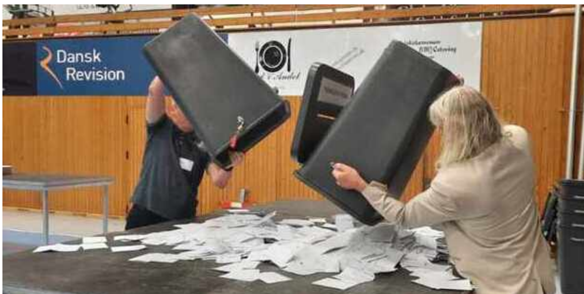
To valgtillordnede tømmer stemmeurnerne på et bord.

Valgstederne lukkede kl. 20, og nu er stemmeoptællingen gået i gang. I alt har 23.709 vælgere i Frederikssund Kommune sat et kryds, hvilket giver en valgdeltagelse på 67,77%.