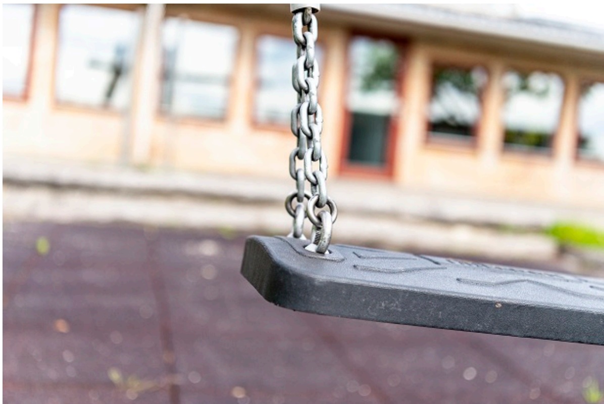
Gynge på legeplads.