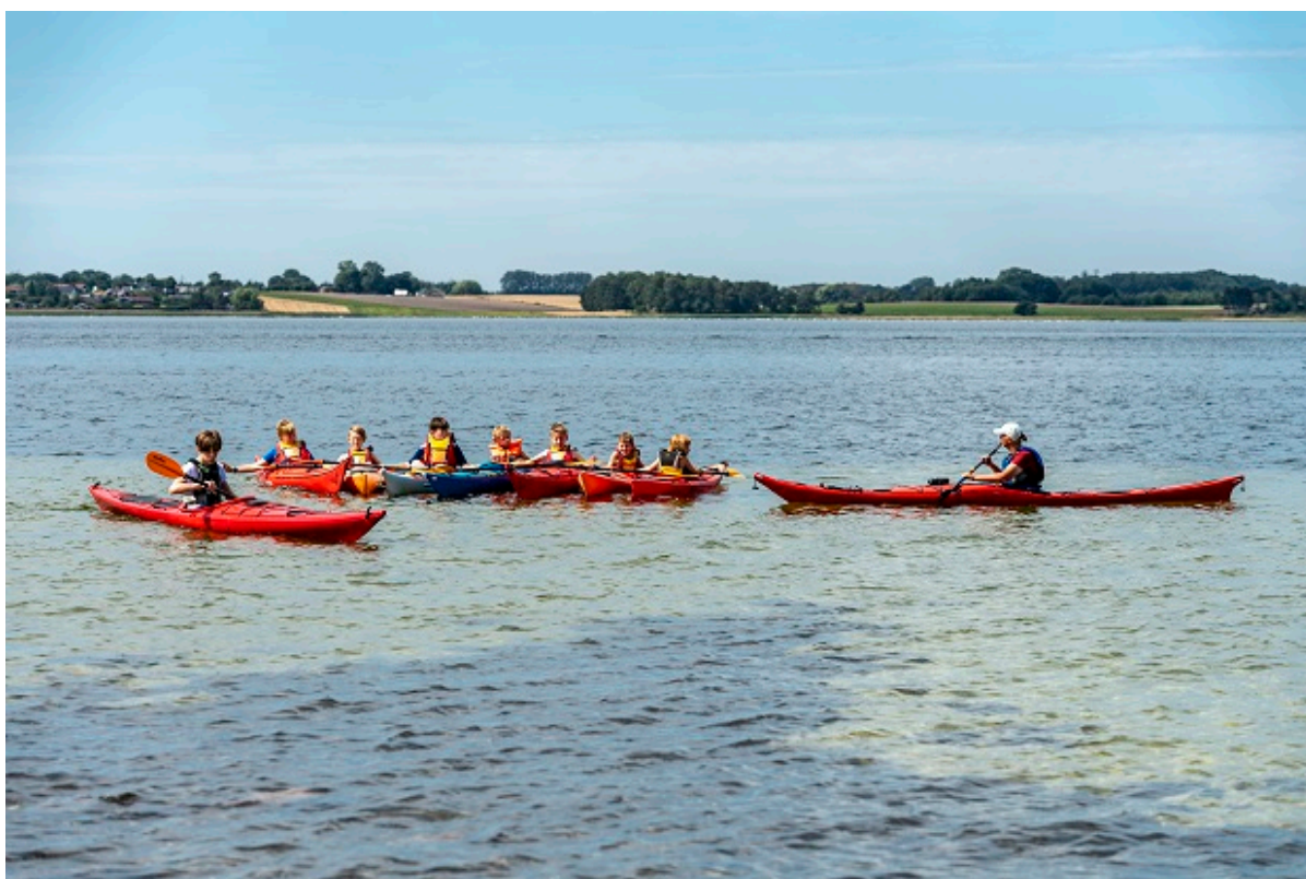
Unge sejler i kajak på fjorden.

Sommeren 2022 er godt på vej og snart er det sommerferie. Igen i år er der masser af sjove aktiviteter for børn og hele familien rundt omkring i Frederikssund Kommune.