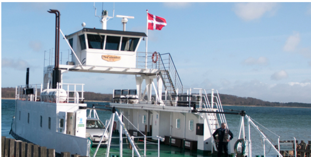
Færgen MF Columbus.

Færgen M/F Columbus er nu repareret og vil efter den sidste klargøring kunne genoptage sejladsen på ruten Kulhuse – Sølager.