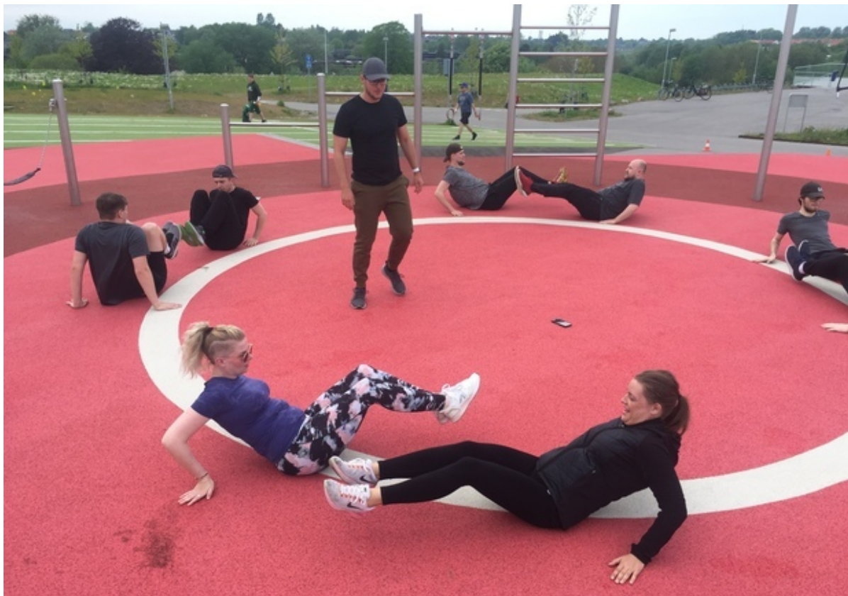
Unge træner på den udendørs gymnastiksal i Idrætsbyen.

I Ungekontakten mødes en gruppe udfordrede unge om at træne til deltagelse i forhindringsløbet Copenhagen Warrior og få inspiration til en sundere livsstil. Træningen giver både fysisk og psykisk gevinst og gør de unge bedre rustet til at starte uddannelse eller job.