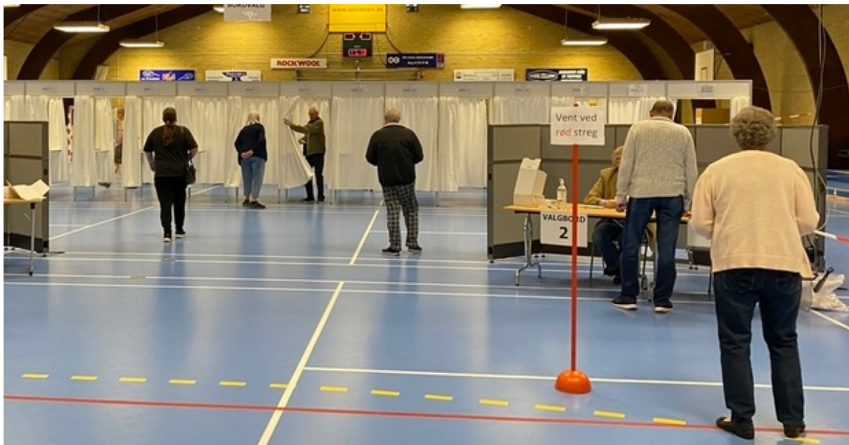
Valghandlingen er i gang i Skibbyhallen.

Valgdeltagelsen til folkeafstemningen om forsvarsforbeholdet ligger kl. 12 på 25,58%. Dermed har lidt over hver fjerde vælger afgivet sin stemme.