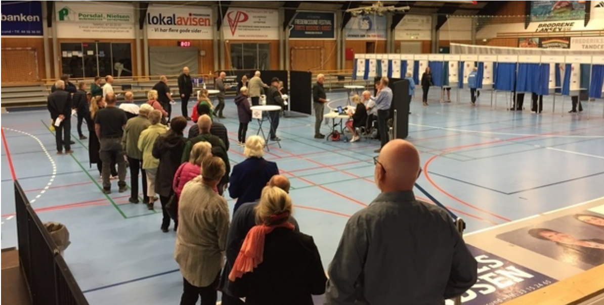
Vælgere i Frederikssundhallen.

Den 1. juni er der folkeafstemning i Danmark om forsvarsforbeholdet. Valgstederne er åbne fra kl. 8.00 til kl. 20.00 i aften.