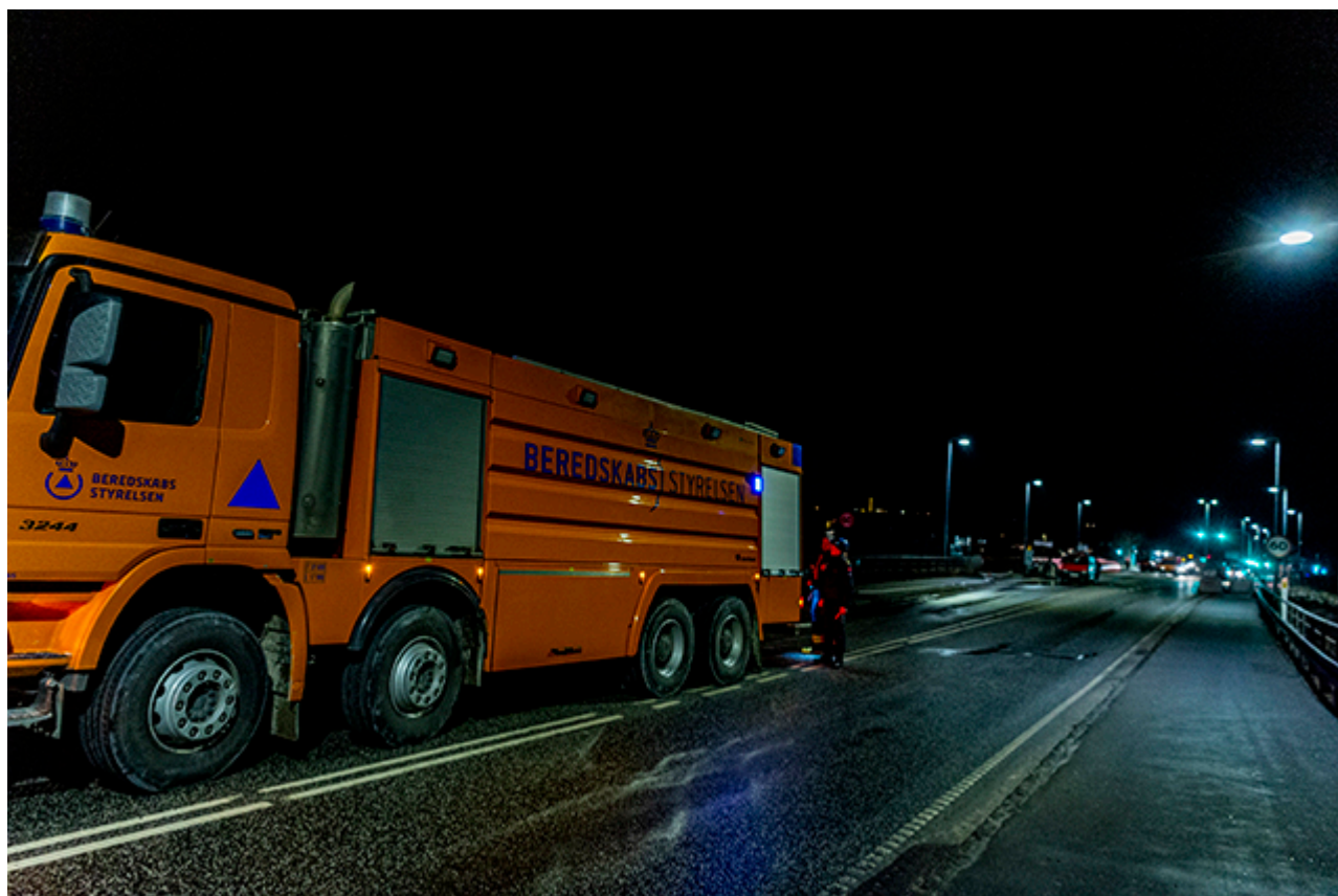
Beredskabsstyrelsen yder assistance.