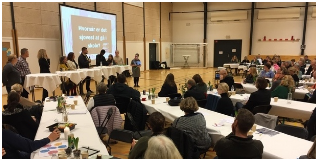
Paneldebat under skoletopmødet.

Det var fremtidens samarbejde om folkeskolen, der var i fokus, da mere end 100 deltagere var til skoletopmøde i Skuldelevhallen onsdag den 16. november. Formålet var at samle alle gode kræfter i og omkring folkeskolen i Frederikssund Kommune i et samarbejde om kvalitetsudviklingen af elevernes læring og trivsel.