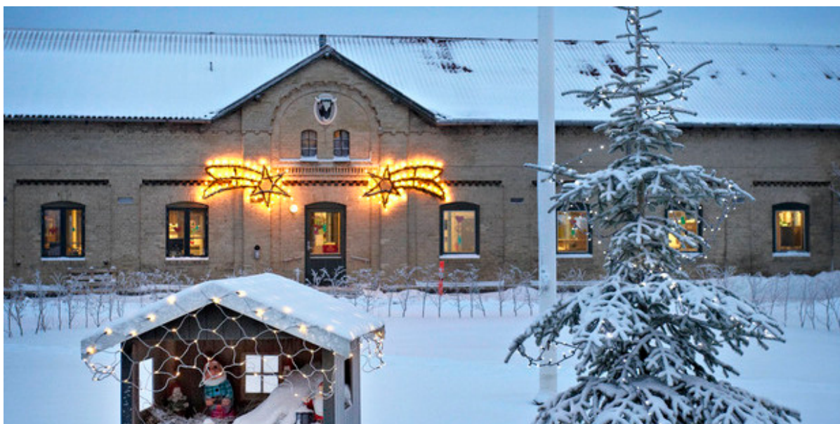
Højagergaard med snedækket gårdsplads og julebelysning.

Så er det blevet tid til årets julemarked på Højagergaard. Det foregår den 19. og 20. november kl. 10-15.