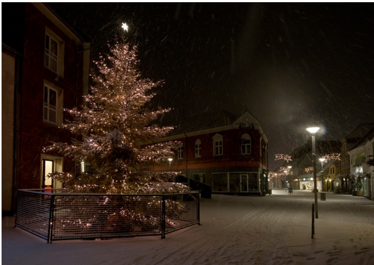
Sneindhyllet juletræ en aften ved Vandkunsten.