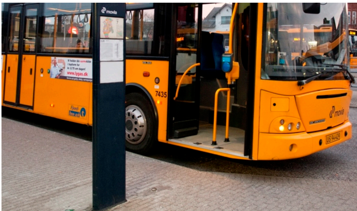
Gul bus holder ved stoppested med døren åben.