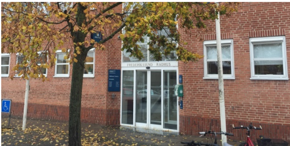
Hovedindgangen på rådshuset i Frederikssund.

Frederikssund Kommune oplever i øjeblikket et teknisk nedbrud på telefonerne. Der kan derfor ikke ringes til kommunen i øjeblikket.