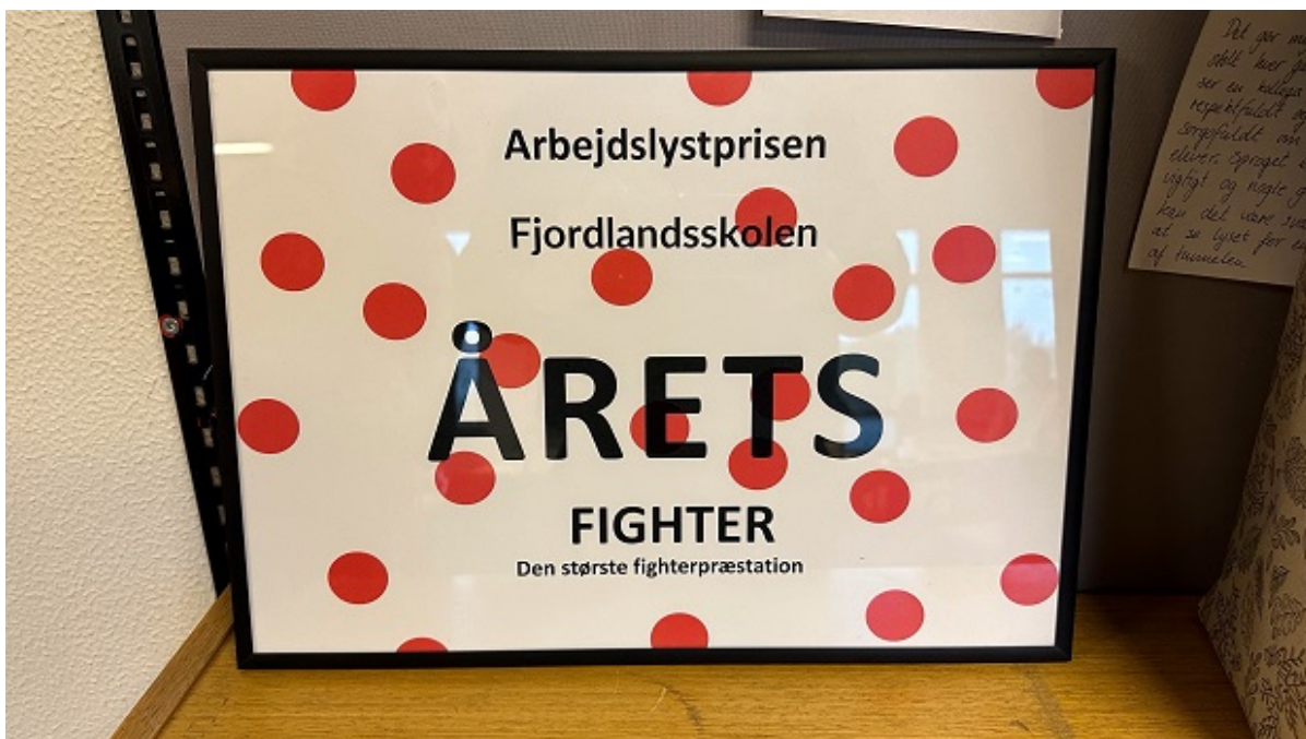
Diplom for prisen som Årets Fighter.