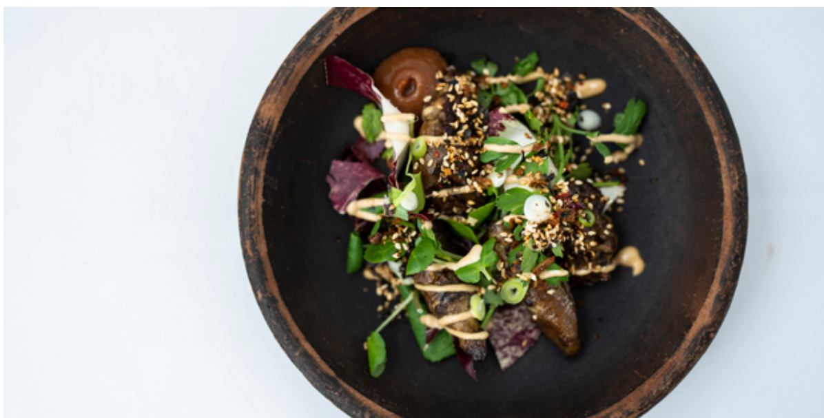
Gourmetmad på en tallerken.

Den Lokale Aktionsgruppe for Frederikssund og Lejre Kommuner - LAG Fjordlandet – inviterer nu til møde og fællesspisning for at præsentere gruppens udviklingsstrategi.