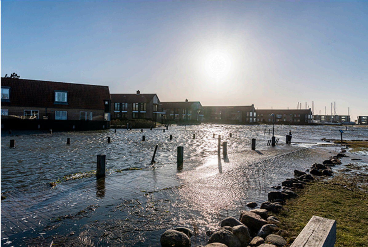
Højvande ved Skillebakke Havn.

Siden søndag aften og nat har beredskabet arbejdet på at rydde op efter storm og højvande. De sidste watertubes bliver fjernet i løbet af tirsdagen.