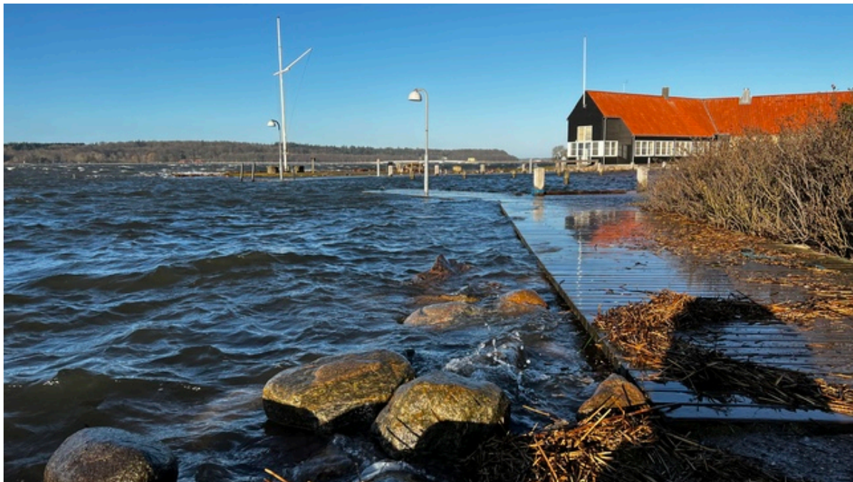
Skyllebakke Havn.

Hvis du oplever væltede træer eller andre konsekvenser af stormen skal du ringe på tlf. 114 - eller hvis der er akut fare på 112.