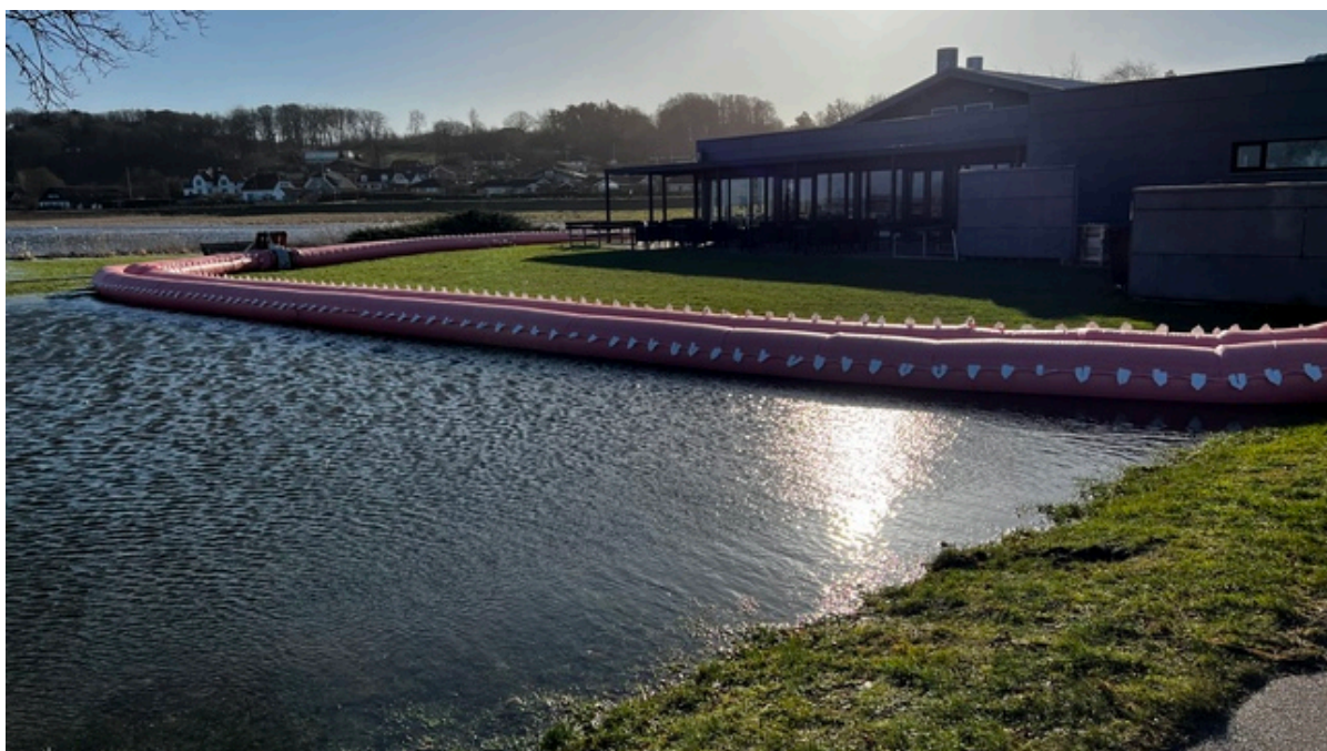
Watertuben ved Kignæshallen har holdt vandet væk fra hallen.

Ifølge DMIs prognoser og målinger har vandstanden i Isefjorden nu toppet. Også nord for Kronprins Frederiks Bro måles der nu faldende vandstand. Syd for broen ventes vandet nu at toppe omkring kl. 20 med en vandstand på ca. 1,5 meter over normalen.