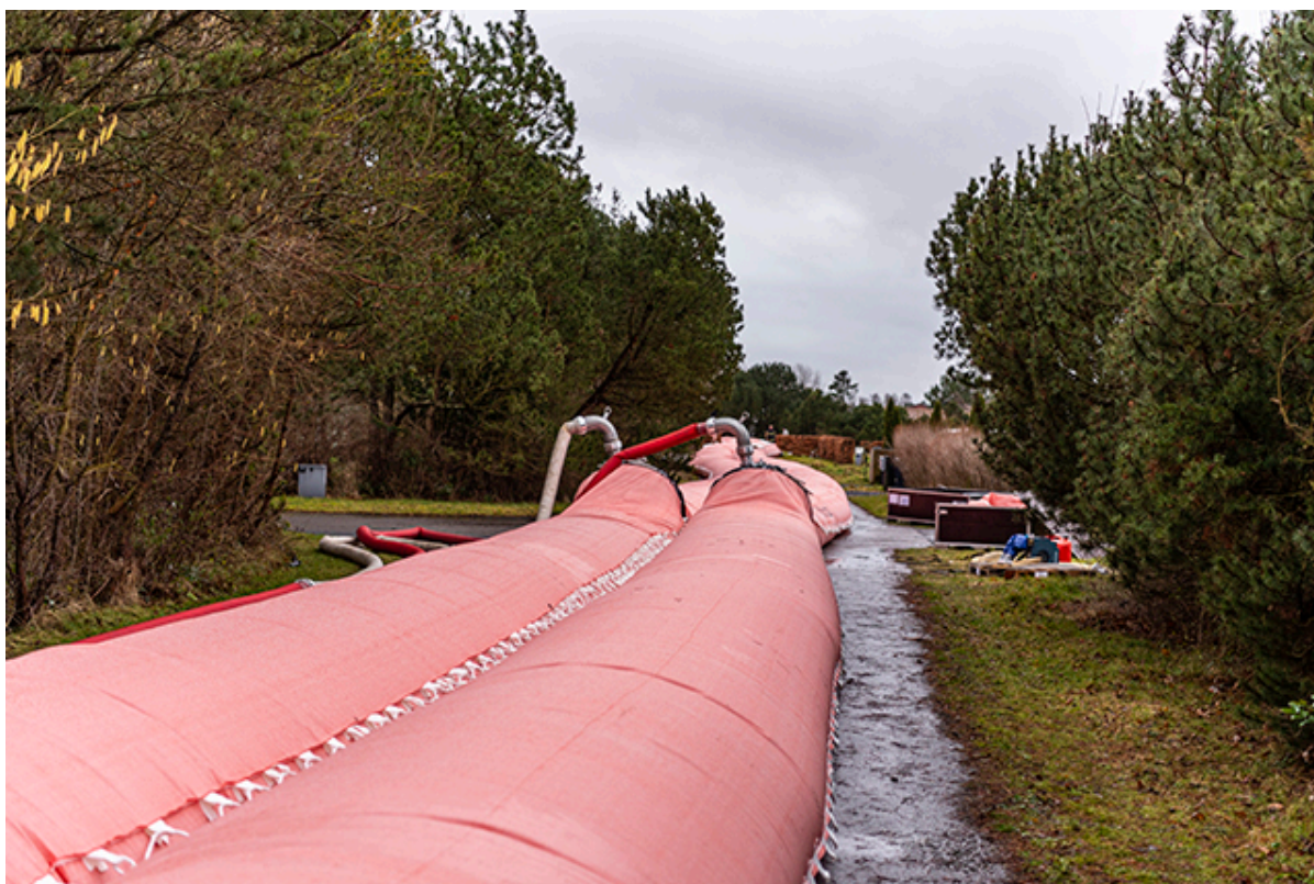
Watertubes i Hyllingeriis, der fyldes af Beredskabsstyrelsens enorme pumper.