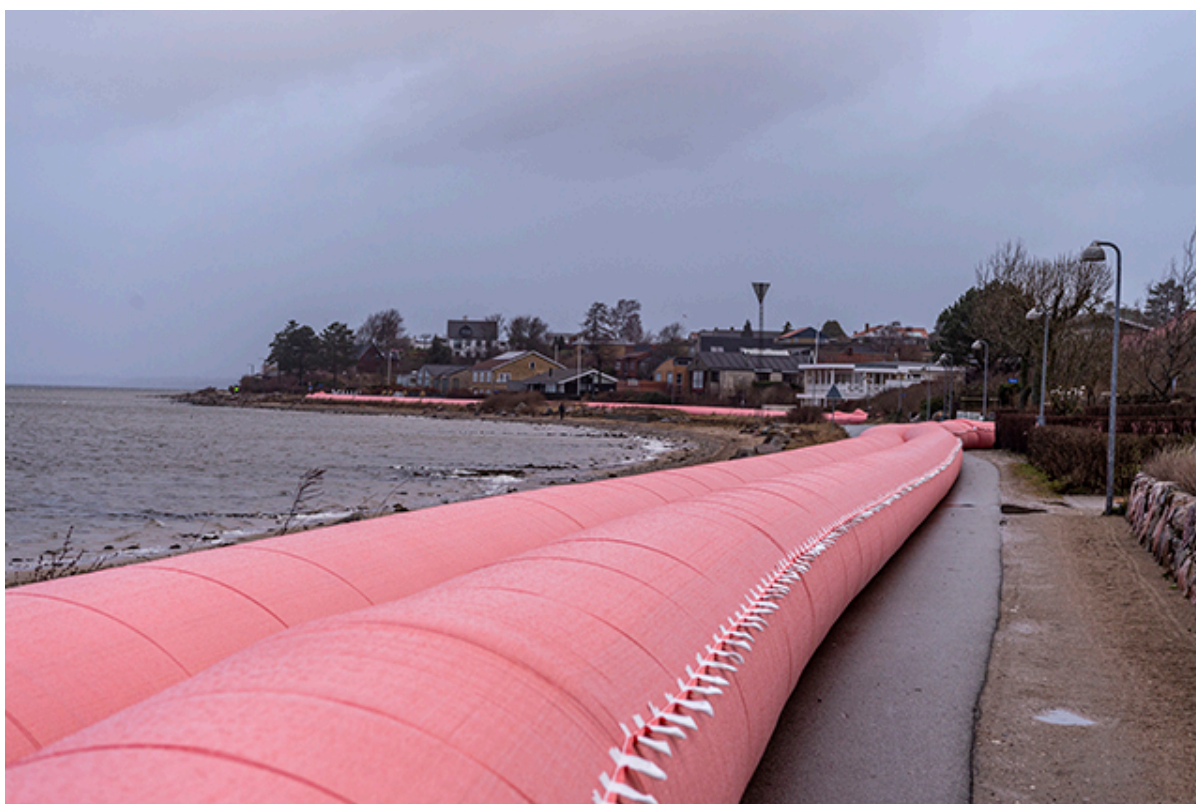
Watertubes langs Strandvej i Frederikssund ved stromfloden Malik i januar 2022.

Onsdag den 20. december kl. 10.00 påbegynder Frederiksborg Brand og Redning udlægning af watertubes.