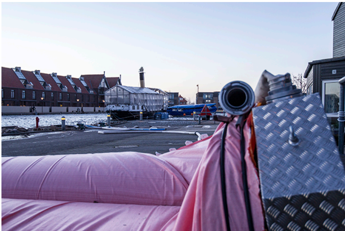
Udlægning af watertubes på Nordkajen i Frederikssund.