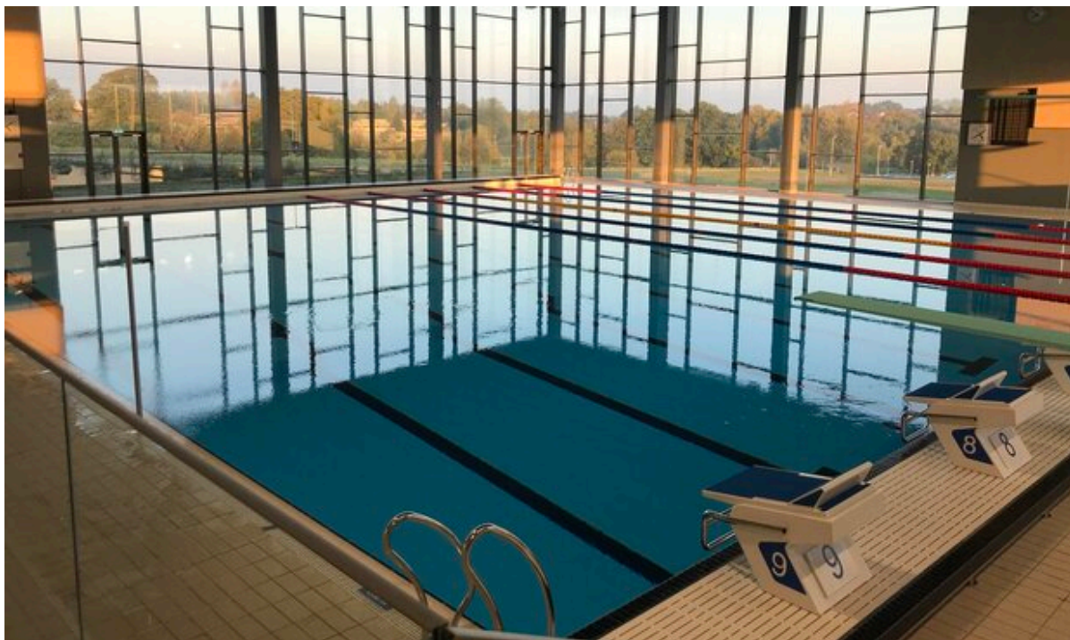
Frederikssund Svømmehal.

I perioden den 12. juni til den 3. september bliver omklædningsrummene i Frederikssund svømmehal ombygget. Det betyder, at svømmehallen vil være lukket i denne periode.