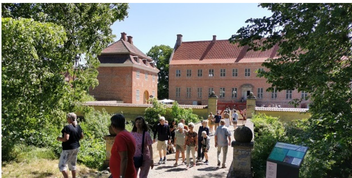
Selsø Slot en livlig sommerdag.

1.juli inviterer Selsø Slot til åbent hus med gratis entré og en masse sjove, informative og kreative aktiviteter for både store og små.