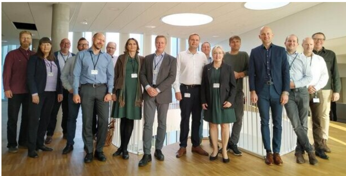
Energipartnerskabet til gruppemøde hos CO-RO A/S i september 2022.