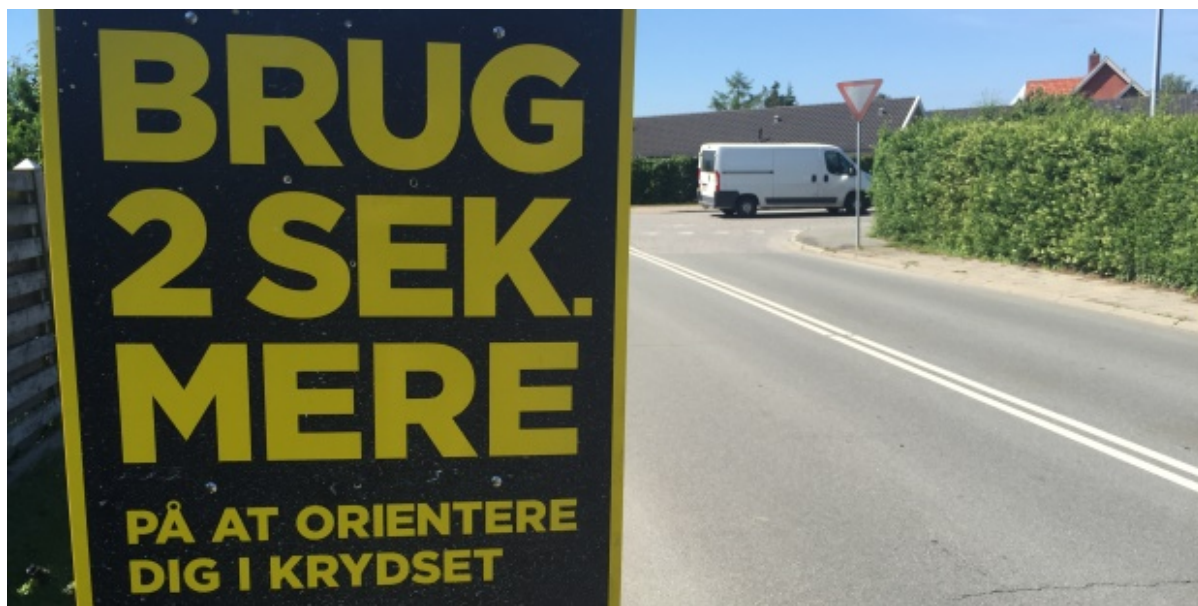
Kampagneplakat opsat kort før kryds.

- på at orientere dig i krydset. De kommende uger sætter Frederikssund Kommune fokus på de mange kryds, vi kører gennem hver dag. Det er her, at to ud af tre alvorlige ulykker sker med cyklister.