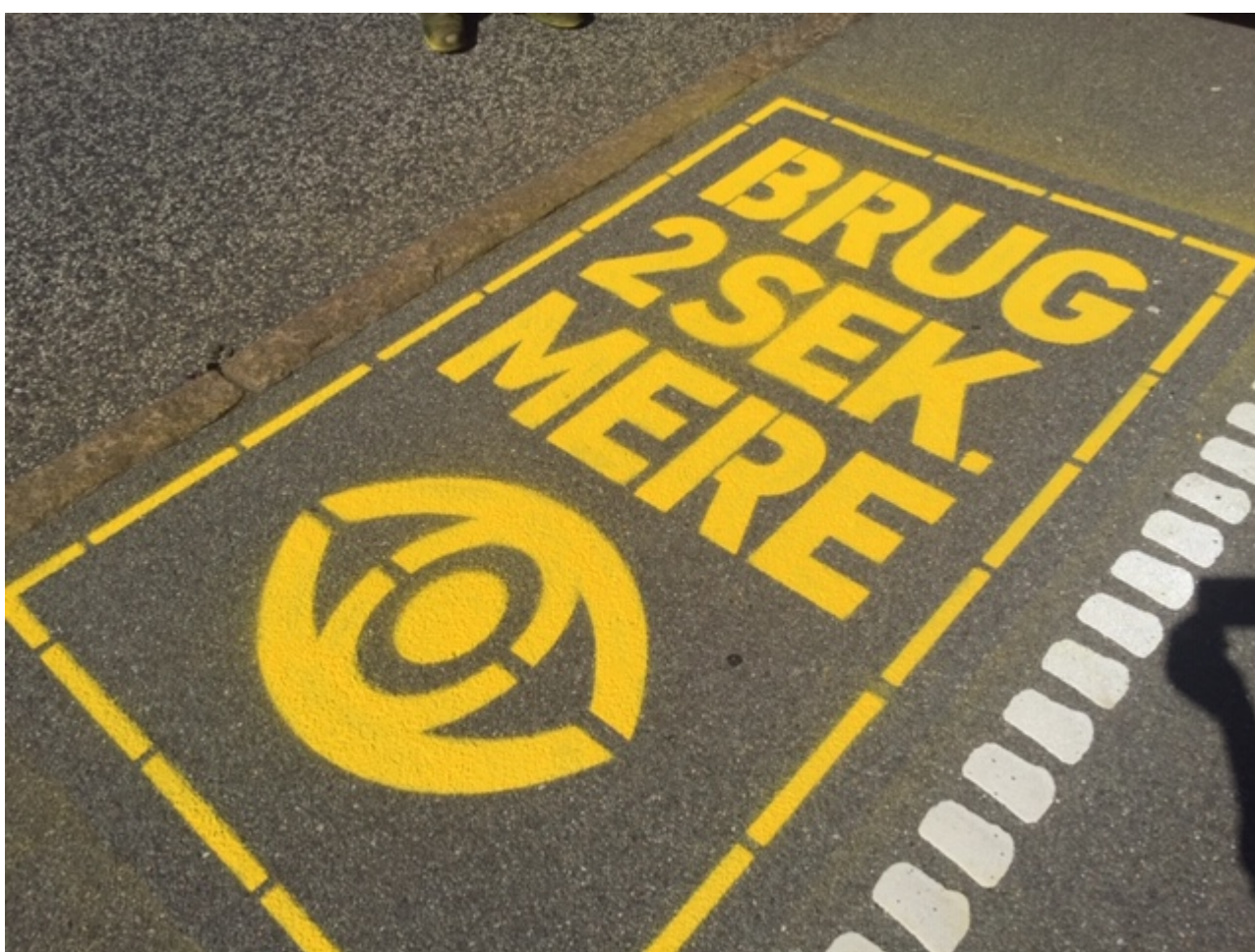
Kampagnegrafik malet på cykelstien.

Frederikssund Kommune er igen i år med i den landsdækkende kampagne "Brug 2 sekunder mere" sammen med Rådet for Sikker Trafik. Formålet er at nedbringe antallet af alvorlige cykelulykker. Budskabet til både bilister og cyklister er at bruge en lille smule ekstra tid på at orientere sig i krydset.