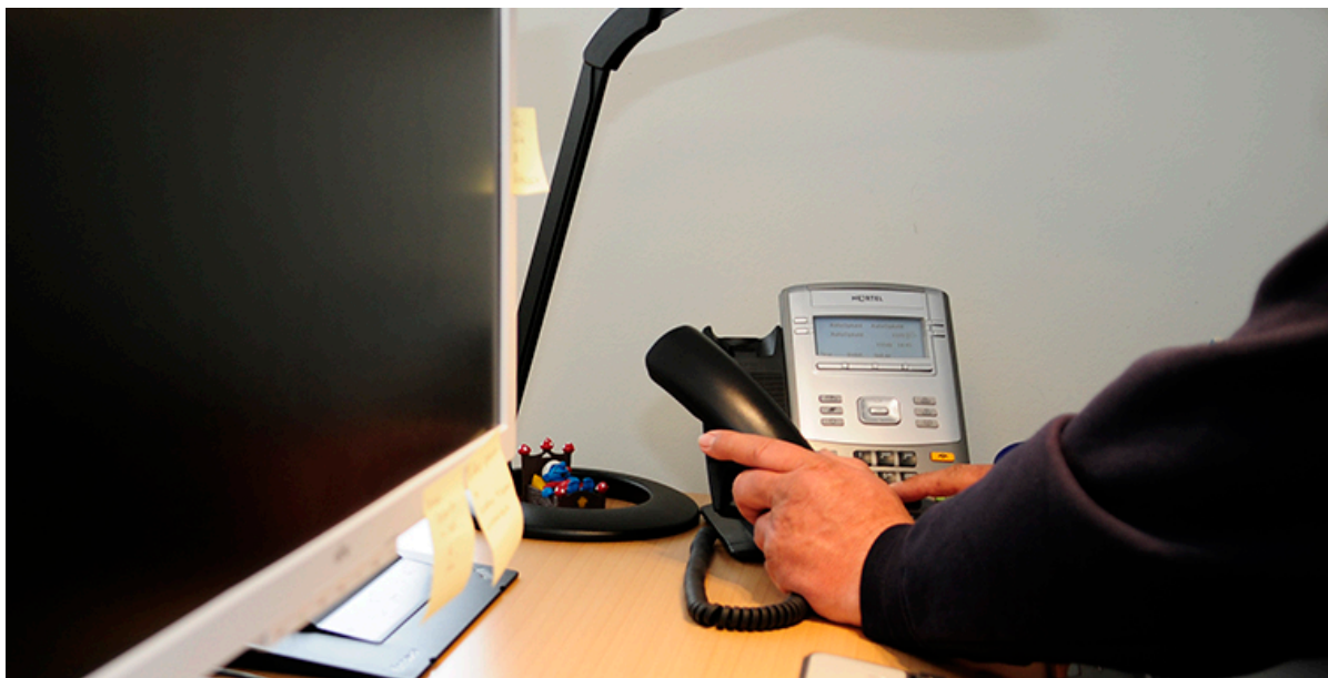
Forsidekampagne - Medarbejder tager telefonen.