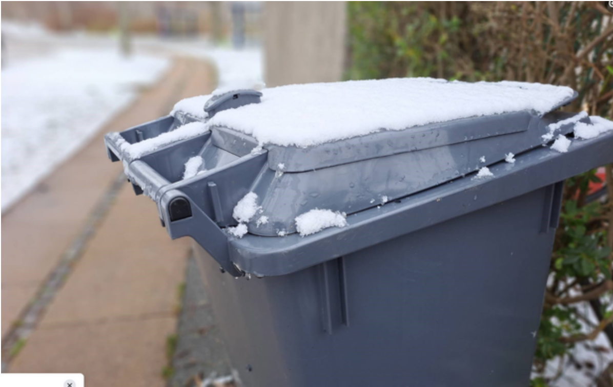
Affaldsbeholder på fortov.

Pga. stormvarsel kan dit affald blive afhentet før eller efter tømmedagen de kommende dage.