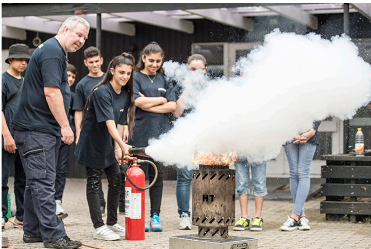
Juniorbrandkorps slukker ild.

Frederiksborg Brand og Redning oplyser, at de ikke har planer om at indføre afbrændingsforbud omkring sankthans i 2023. Situationen genovervejes dog onsdag den 21. juni 2023.