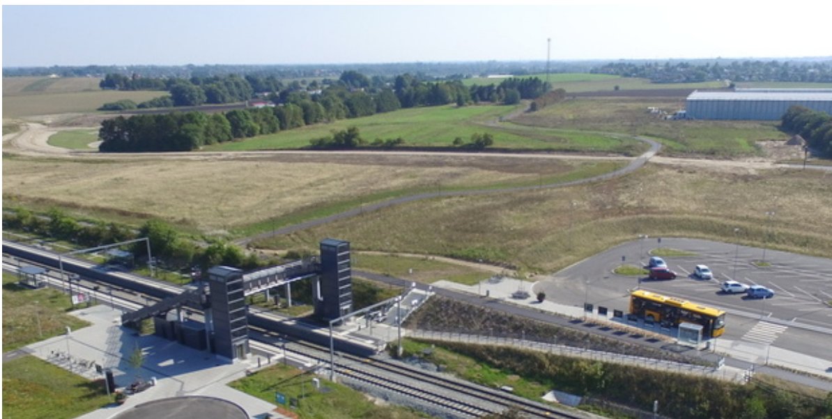
Vinge Station og p-plads.