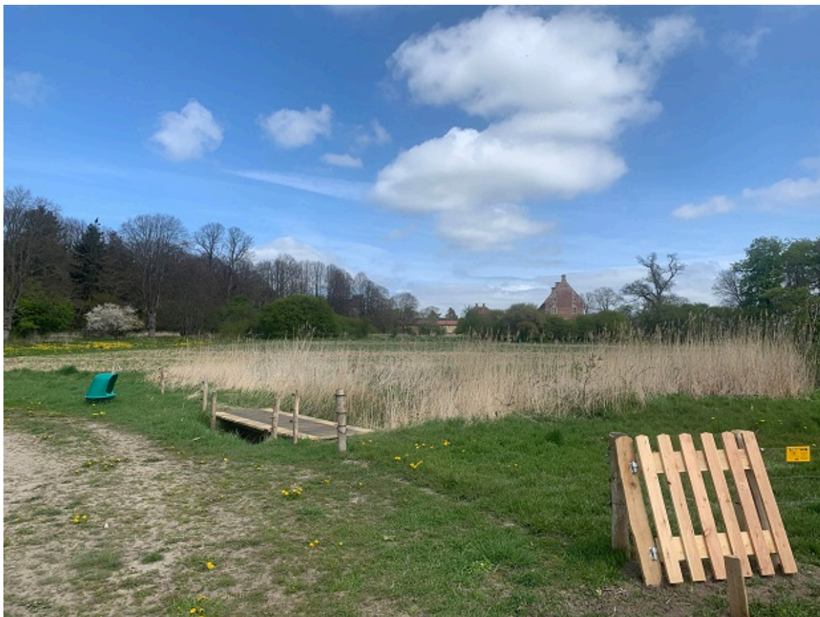
Låger ind til udvidelsen af Fjordstien.