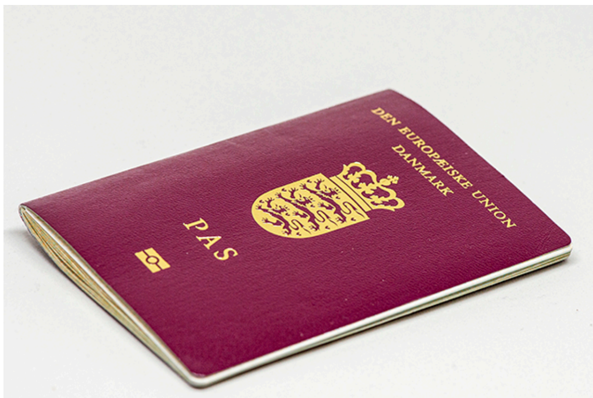
Dansk pas.

Borgercentret har lagt mere end 150 ekstra tider ind til pasbestilling.