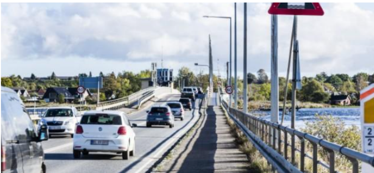
Biltrafik på Kronprins Frederiks Bro.

I marts og april skal Vejdirektoratet i gang med en større renovering af Kronprins Frederiks Bro. Det betyder lukning af kørebanerne på broen i seks uger, og kun cyklister og fodgængere kan benytte broen, mens arbejdet står på.