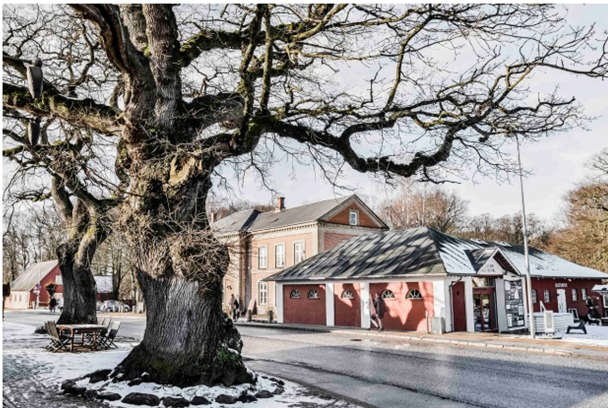
Rejsestalden i vinterlandskab.