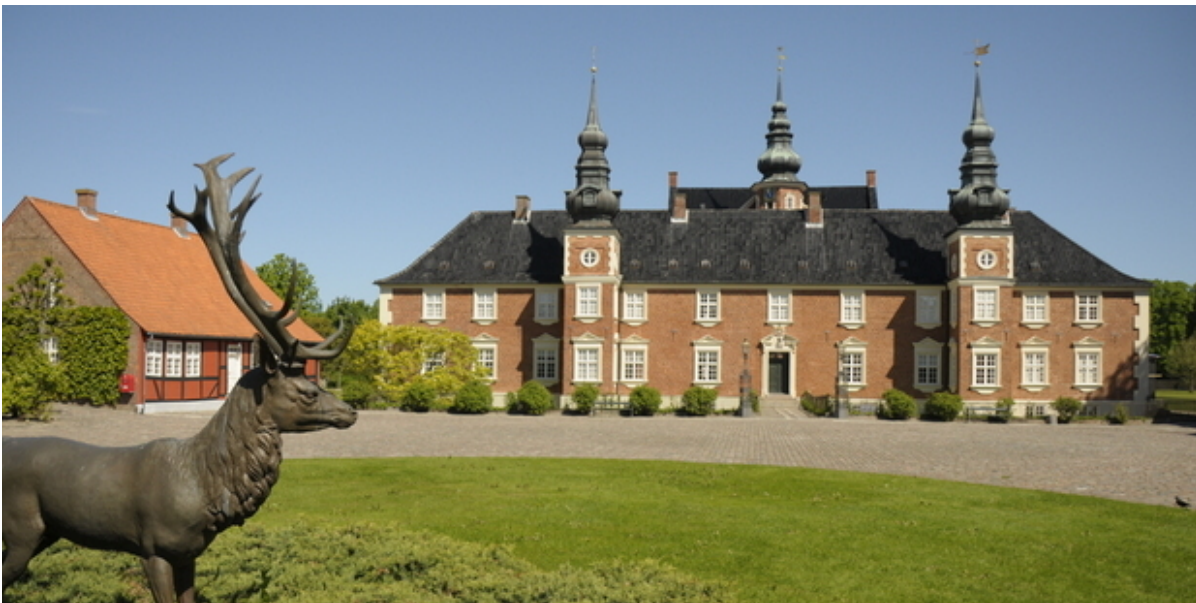
Jægerspris Slot.

Virksomheder i turistbranchen kan nu søge om at deltage i et gratis rådgivningsforløb, hvor man lærer at lave klimaregnskab og planer for reduktionsmål mv. Ansøgningsfristen er 31. januar.