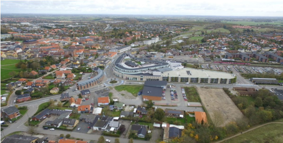
Frederikssund bymidte set fra luften.