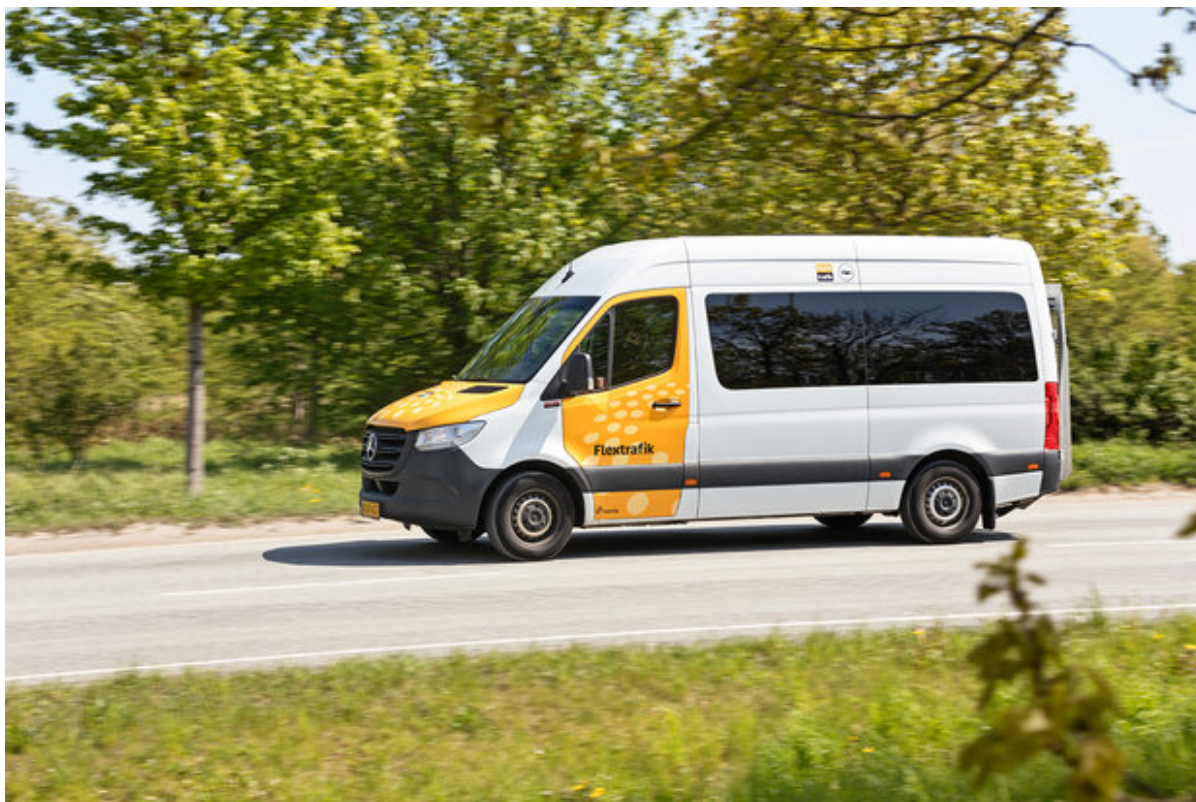
Flexbus kører hen ad vejen.

Fra den 19. januar bliver det dyrere at benytte Movias tilbud Flextur. En tur på 10 kilometer inden for kommunegrænsen stiger således med 17 kr. fra den 19. januar.