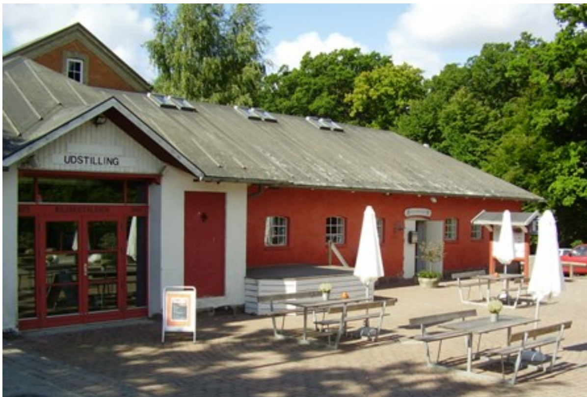
Kulturhuset Rejsestalden.