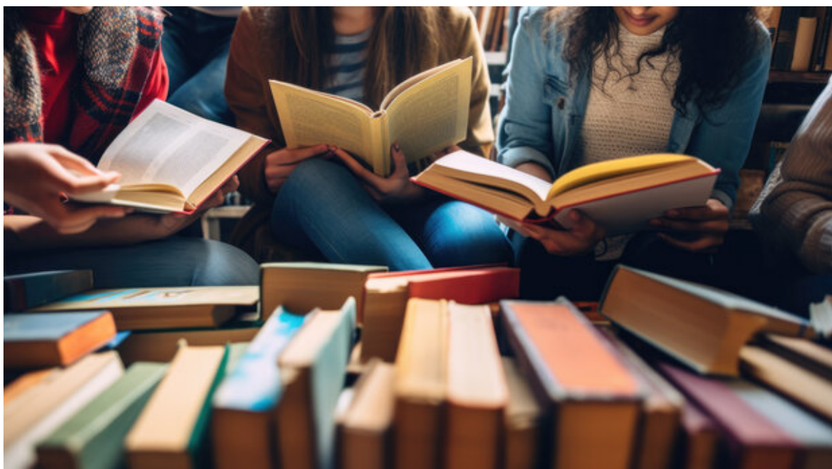
Unge mennesker læser bøger.