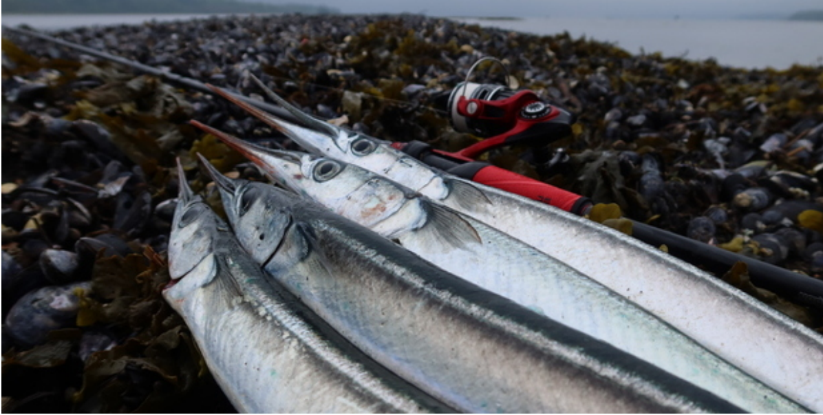
Fire hornfisk på land.

Drømmer du om at komme ud på en vaskeægte fisketur efter den spændende hornfisk? Så har du nu muligheden for at komme på fisketur med en erfaren Fishing Zealand guide til Roskilde Fjord.