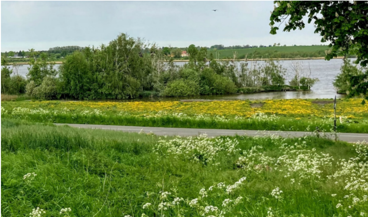
Grønt område med mælkebøtter ud til fjorden.

Byrådet har netop vedtaget en ny naturstrategi, der sætter retning for, hvordan kommunen skal forvalte naturen. Herunder blandt andet hvordan der skal arbejdes for at sikre biodiversiteten, beskytter truede dyr og planter samt arbejde med skovrejsning i kommunens landområder.