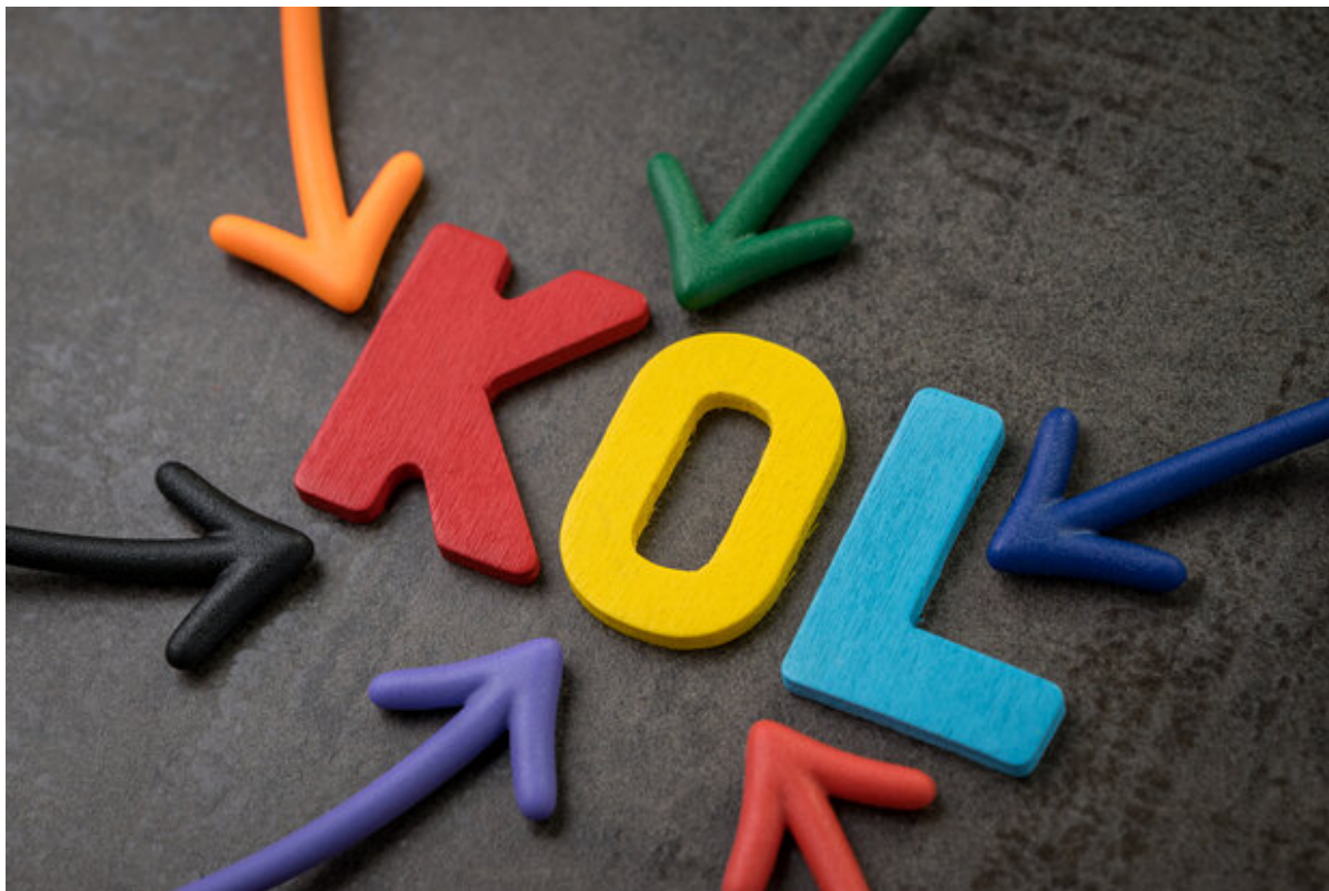
Farvede bogstaver danner ordet KOL.

Du inviteres til gratis tværsektoriel KOL-café. Kom og bliv klogere på søvnens betydning og få idéer til, hvad du kan gøre for at opnå en bedre søvn. Du vil bl.a. høre om bekymrings søvnløshed, sovemedicin og kronisk sygdoms påvirkning på søvnen.