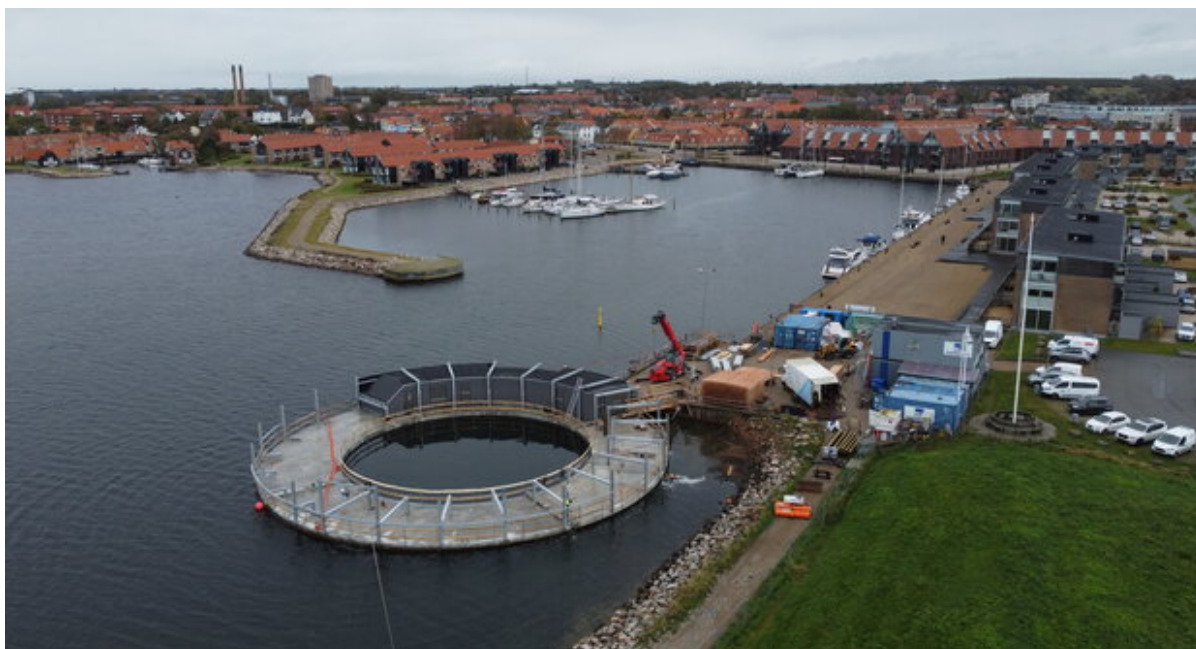
Kultur- og havnebadet ved indsejlingen til Frederikssund Havn.

Arbejdet med Kultur- og havnebadet på kulturhavnen i Frederikssund er nu så langt, at der onsdag den 25. oktober blev holdt rejsegilde.