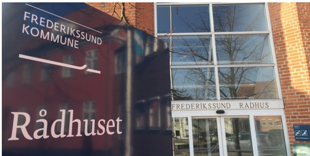
Indgang til Frederikssund Rådhus.

Byrådet har besluttet, hvilke sagsbehandlingsfrister der skal være på det sociale område i de kommende år. Sagsbehandlingsfristerne viser, hvor lang tid der må forventes at gå fra kommunen modtager en ansøgning om hjælp og til at der er truffet en afgørelse. Fristerne fastsættes så de både er forsvarlige i forhold til sagsbehandlingskvaliteten og så de er realistiske.