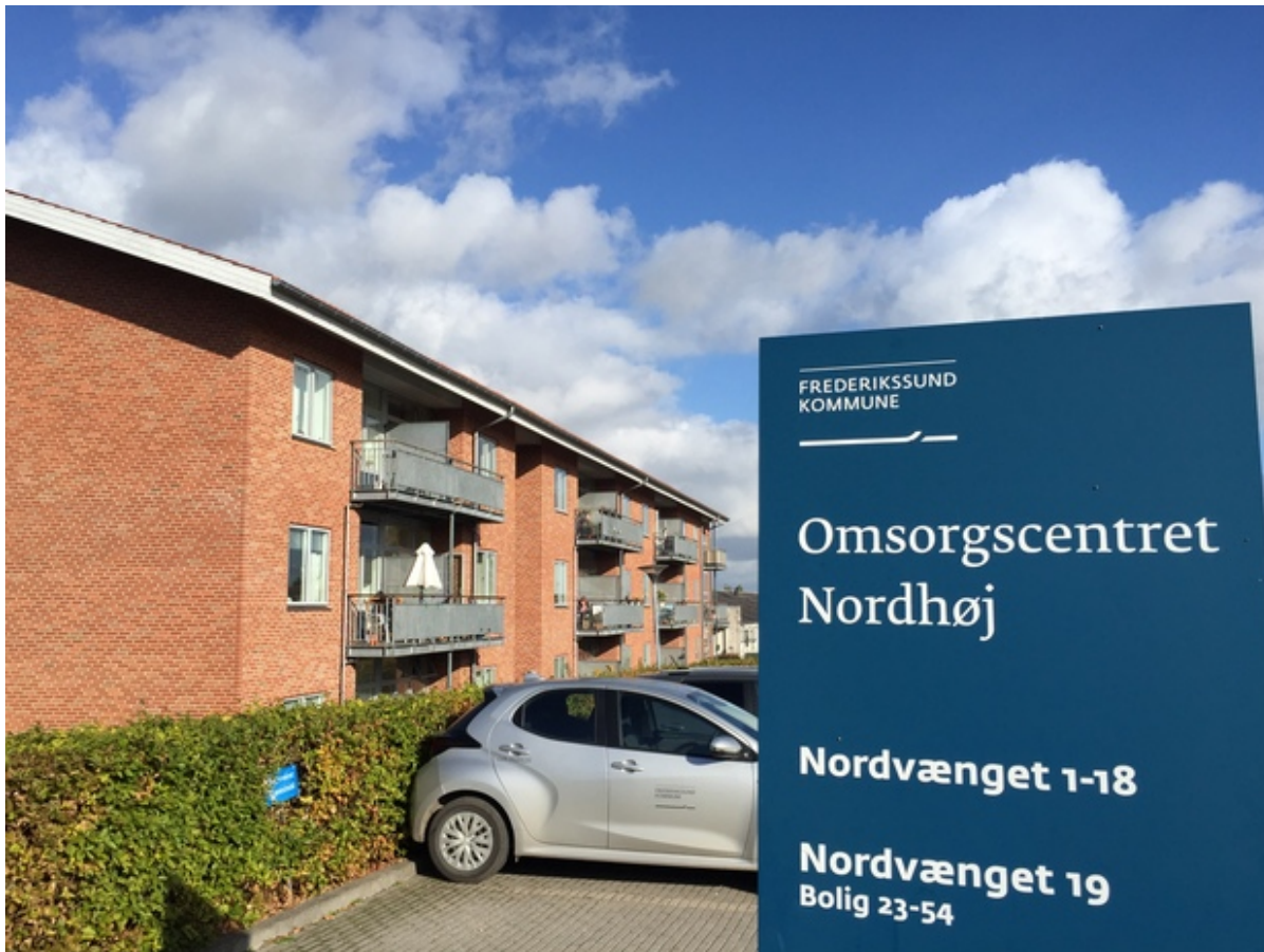
Omsorgscenteret Nordhøj i Skibby.

Omsorgscenter Nordhøj i Skibby har i den seneste tilsynsrapport fået topkarakter i fem ud af seks kategorier.