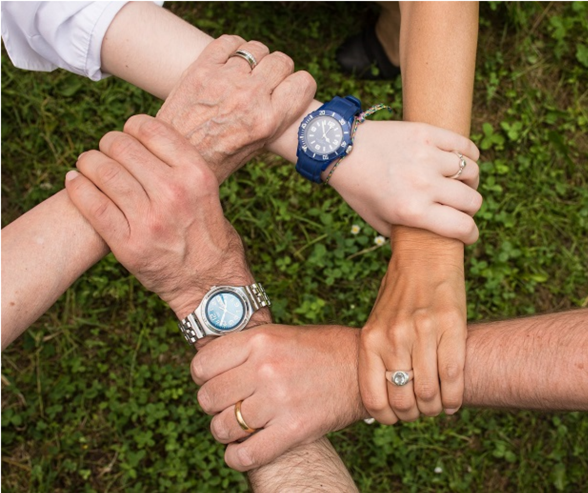
Fem hænder holder om hinandens håndled og danner en cirkel.