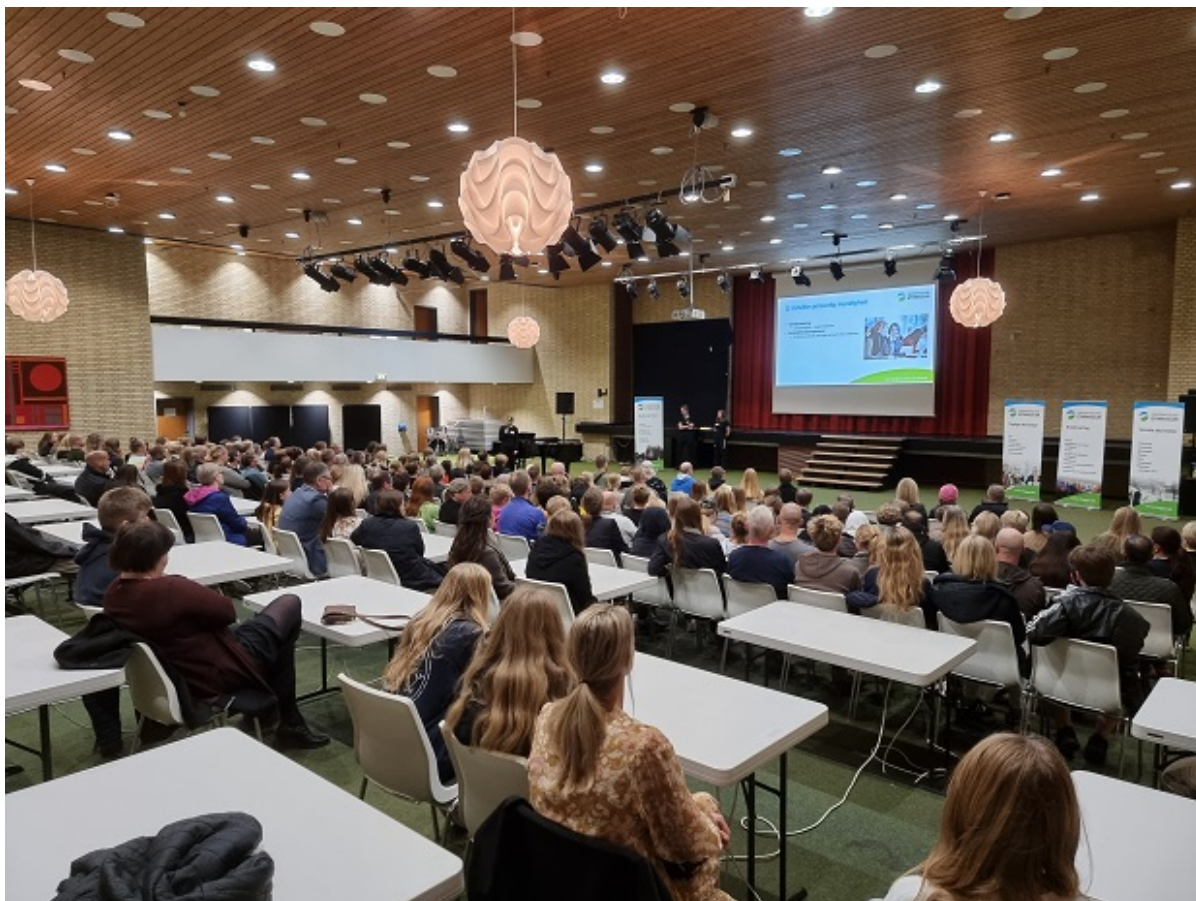
Elever og forældre samlet og lytter til oplæg.