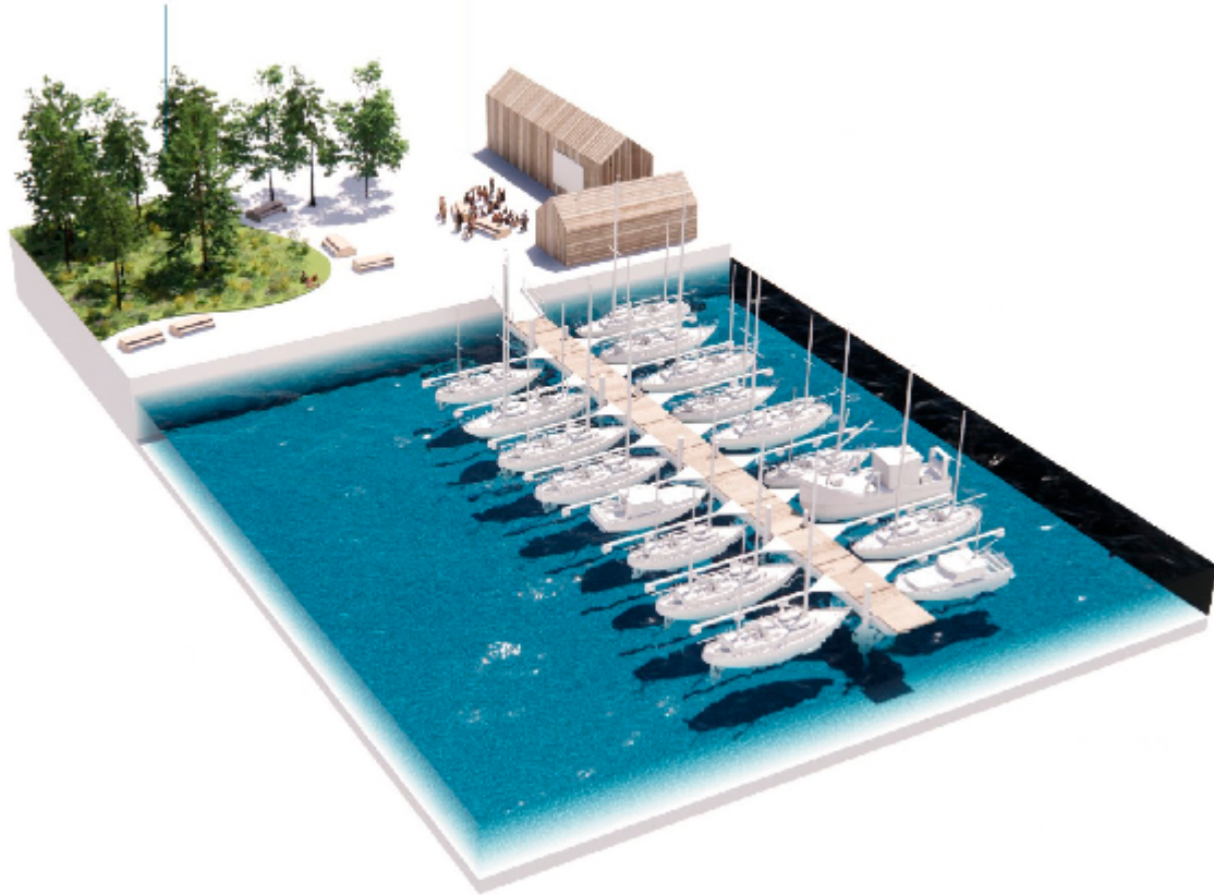
Illustration af havn med bådene i vandet og havneplads med grønt område, siddepladser og plads til ophold.

Billede: RUM as. Illustrationer: JAJA architects ApS