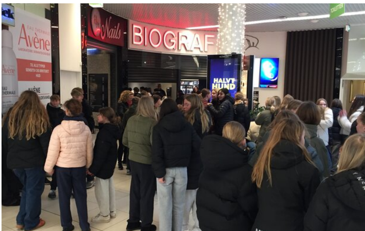
Skoleelever venter udenfor biografen i Sillebrocenteret.

Hvert år i uge 5 bliver de mange skolepatruljeelever landet over takket og forkælet lidt for deres vigtige indsats i trafikken. I år kom de en tur i biffen.