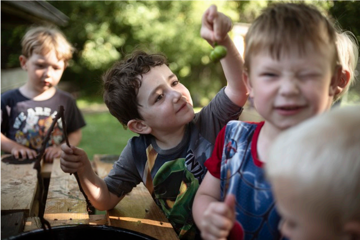
Børn leger udendørs på en varm dag.

En ny organisering af dagtilbudsområdet skal give styrket lokal ledelse og faglighed i de enkelte børnehuse i Frederikssund Kommune.