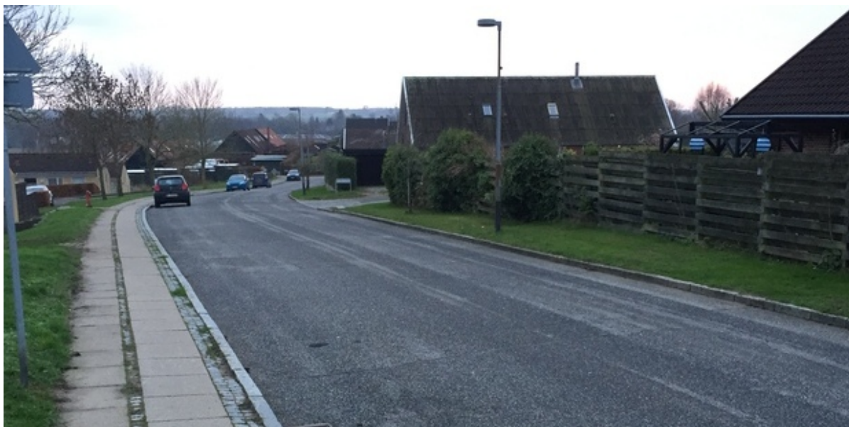
Agervej i Slangstrup.

I en række landsbyer og på en række mindre veje i kommunen bliver hastigheden nu sat ned fra 50 km/t til 40 km/t. Det blev besluttet på Plan og Tekniks møde onsdag den 30. november.