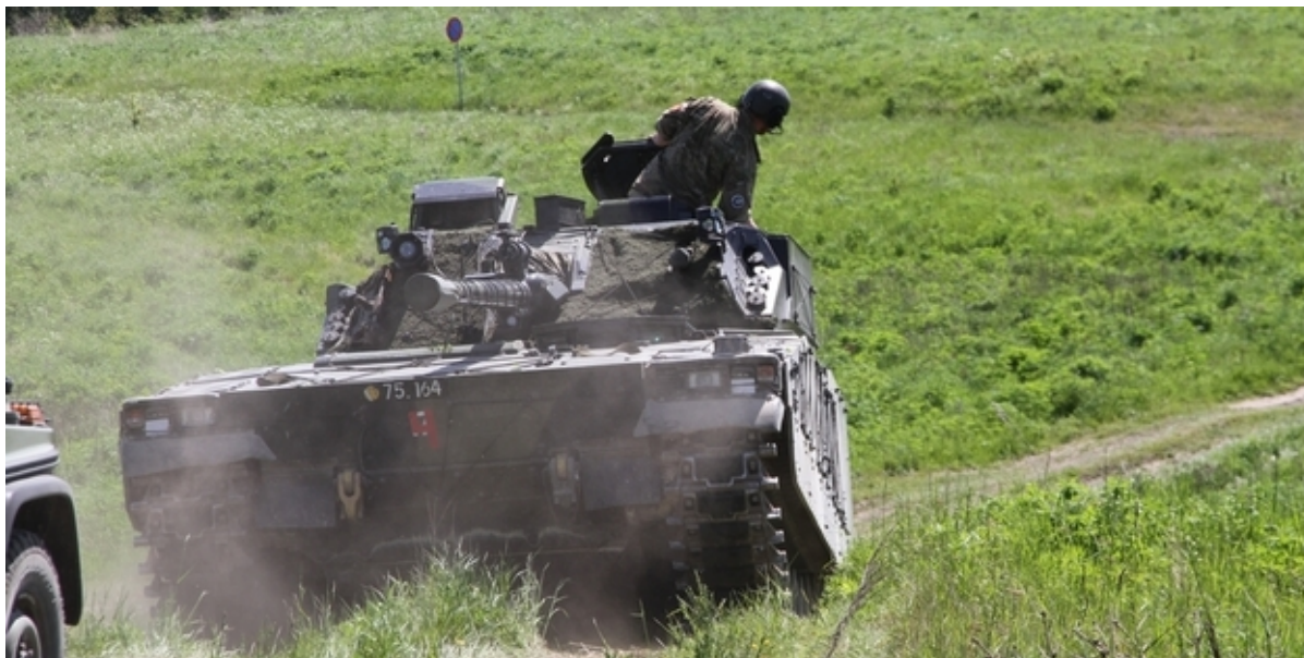
Kampvogn under øvelse på Jægerspris skydeterræn.

Forsvarsministeriets Ejendomsstyrelse har meddelt Frederikssund Kommunes Miljøteam, at der er opstået behov for brug af Jægerspris Skydeterræn og Jægerprislejrens skydebaner i uge 28. Læs her, hvornår du kan forvente støj i området.