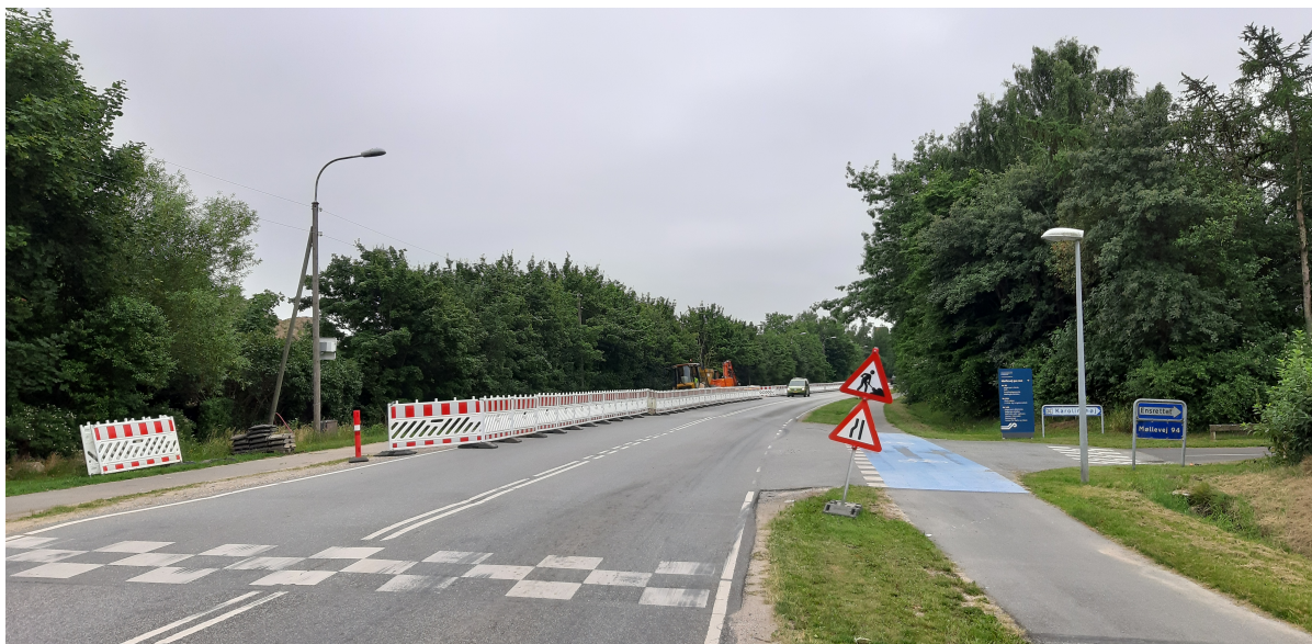
Forberedelser til vejarbejde på Møllevej i Jægerspris.