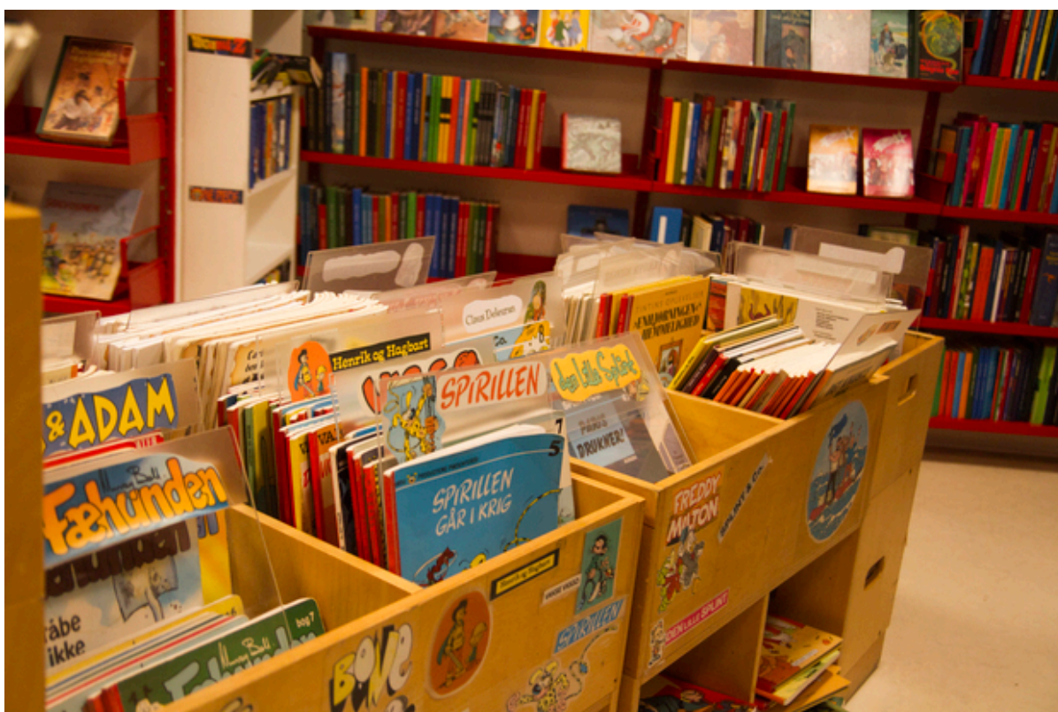
Hylde med bøger på et bibliotek.

Frederikssund Bibliotekerne har søgt "Udviklingspuljen for folkebiblioteker og pædagogiske læringscentre" og fået mere end en million kroner i tilskud til tre udviklingsprojekter.