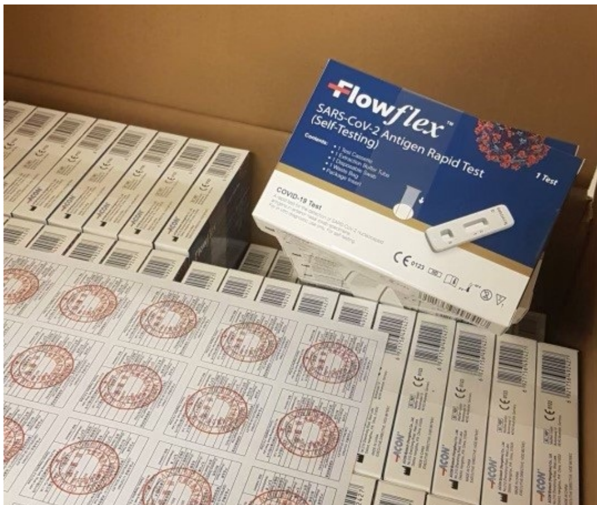
Selvtest sæt.