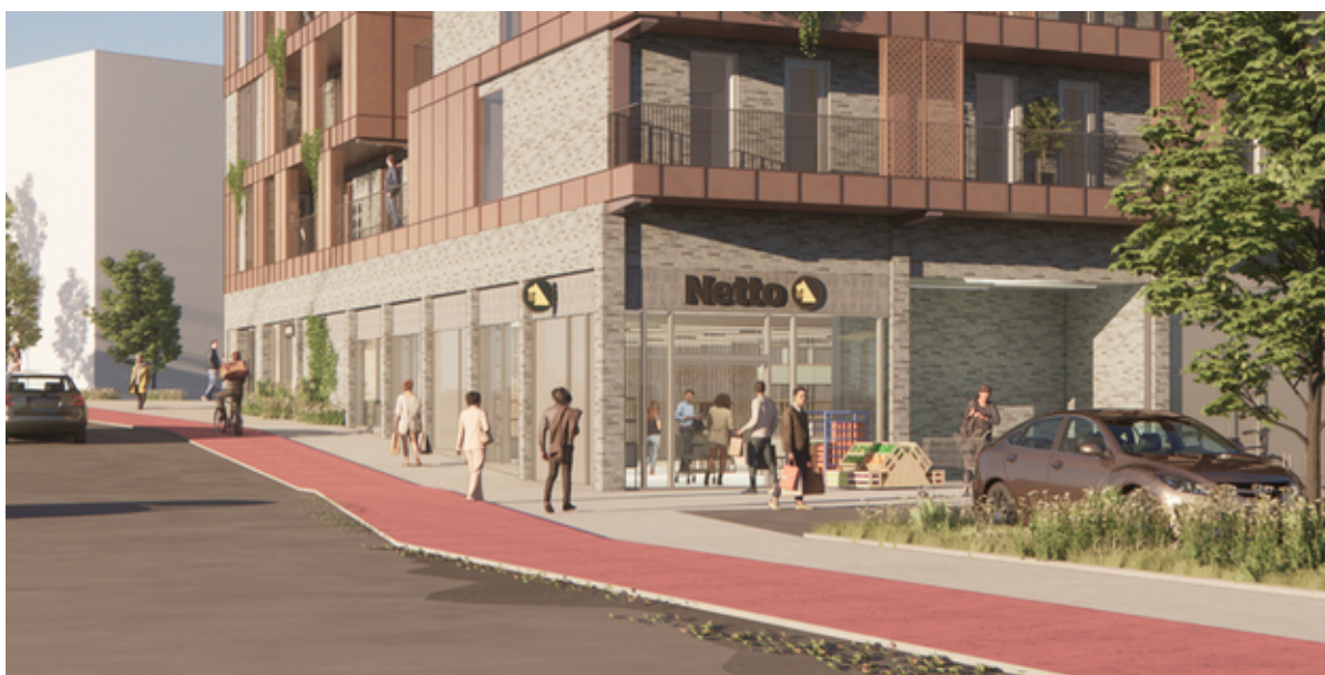
Illustration af Innovaters kommende byggeri i Vinge med en nettobutik i gadeplan. Illustration: Innovater A/S.

Innovater A/S, som skal opføre boliger lige syd for Vinge Station, har lavet aftale med supermarkeds-kæden Netto, der skal åbne en butik i det kommende byggeri i Vinge. Samtidig er der også planer om enten at etablere apotek eller café i bygningerne.