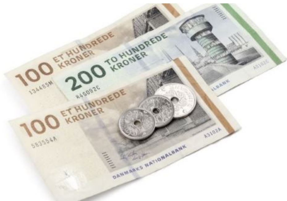
Pengesedler og mønter.