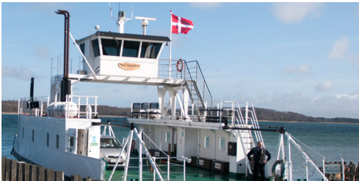
Færgen Columbus i Kulhuse Havn.